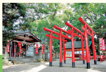
日本最古の稲荷社といわれている「系我稲荷神社」。江戸後期の社伝によると白雉3年(652)の創建とされる