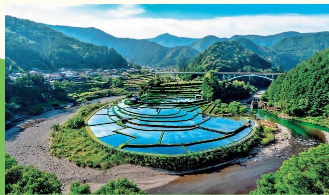
有田川町にある「あらぎ島」は美しい棚田で有名。水田や金色の稲穂など、季節によってさまざまな景色を楽しむ