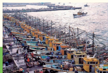
タチウオの漁獲量日本一を誇る有田市。箕島漁港のそばには産直施設「浜のうたせ」がある