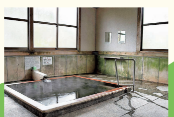
市内に約50の源泉があり、公衆浴場は20軒以上。写真は人吉城跡そばの人吉温泉 元湯