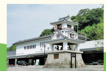
JR人吉駅前にあるからくり時計。毎正時に人吉城のお殿様の物語が曲にのせて展開される