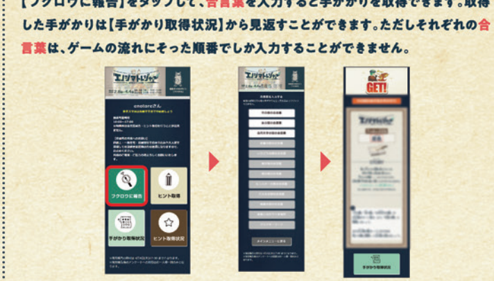
※上記サイト画面は、開発段階の内容のため、変更になることがあります。

STEP.2 宝探しに挑戦して手がかりをゲット ゲーム中に「フクロウに報告しましょう」という指示があったら、検索用WEBサイト「フクロウ」に、現地で見つけた正しい合言葉を入力しましょう。メインメニューの【フクロウに報告】をタップして、合言葉を入力すると手がかりを取得できます。取得した手がかりは【手がかり取得状況】から見返すことができます。ただしそれぞれの合言葉は、ゲームの流れにそった順番でしか入力することができません。