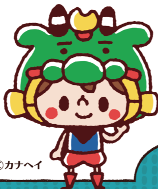
うわじま 牛鬼 ©カナヘイ