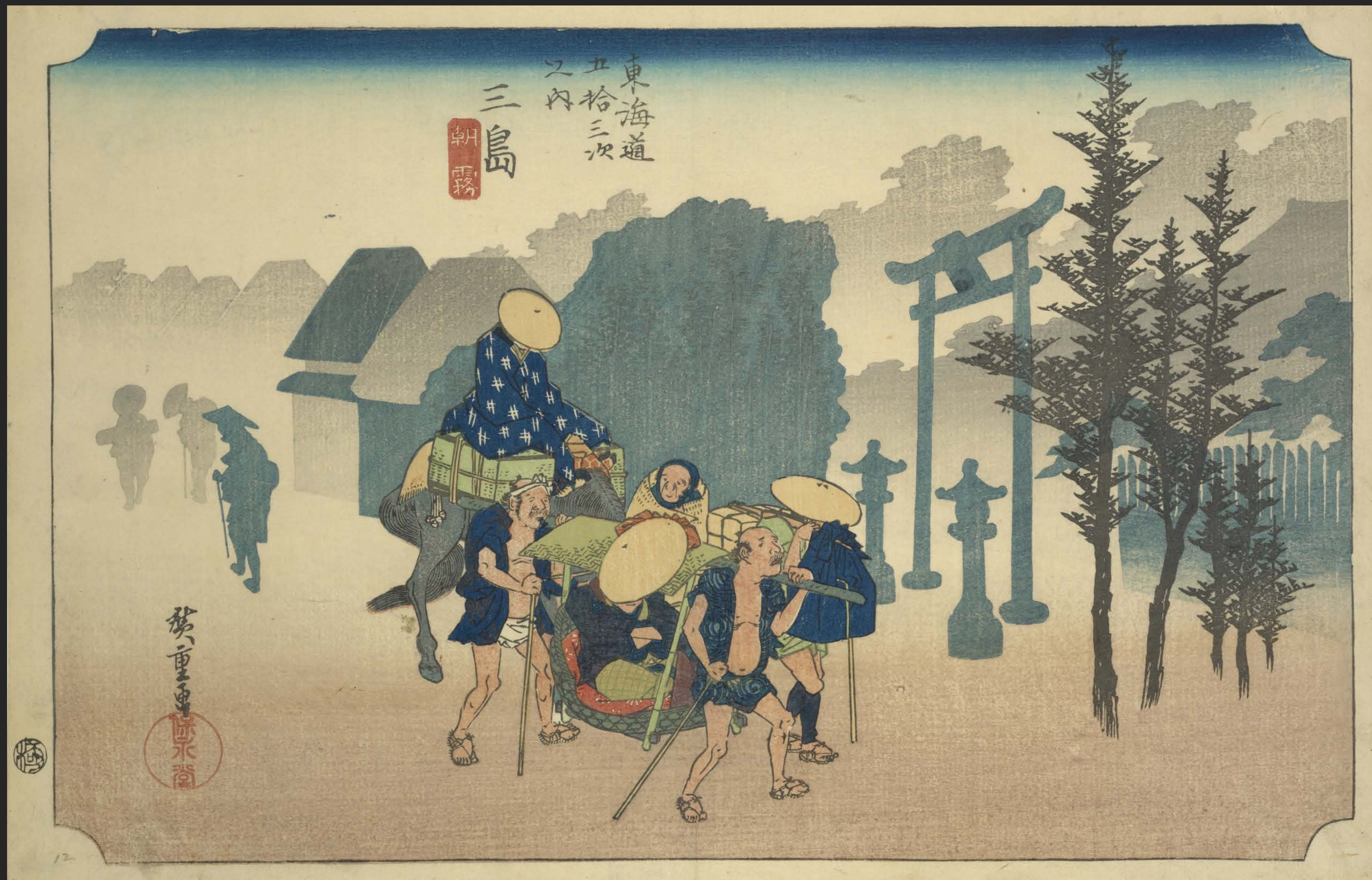
東海道五十三次之内 三島 朝霧