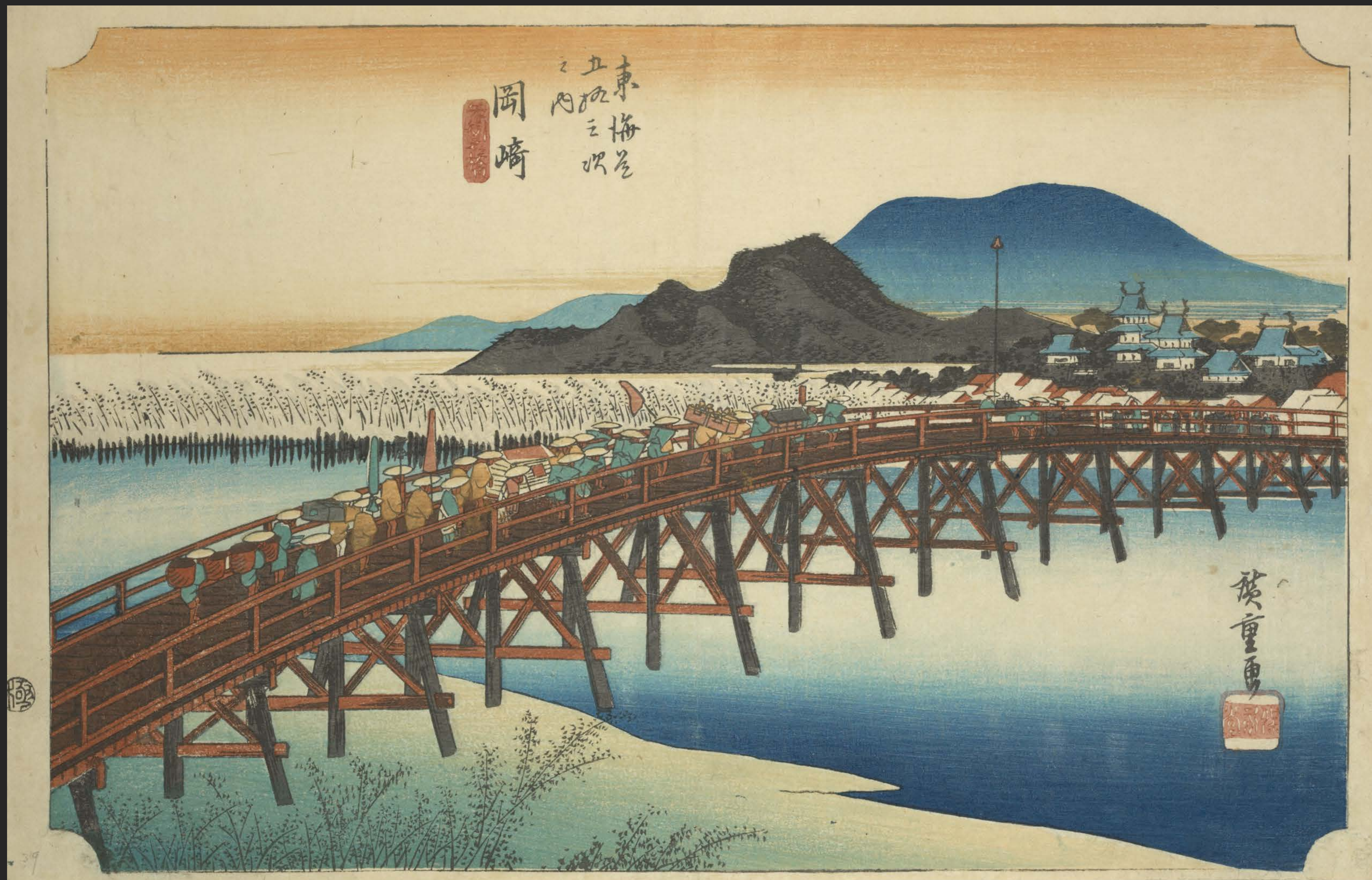
東海道五十三次之内 岡崎 矢矧之橋