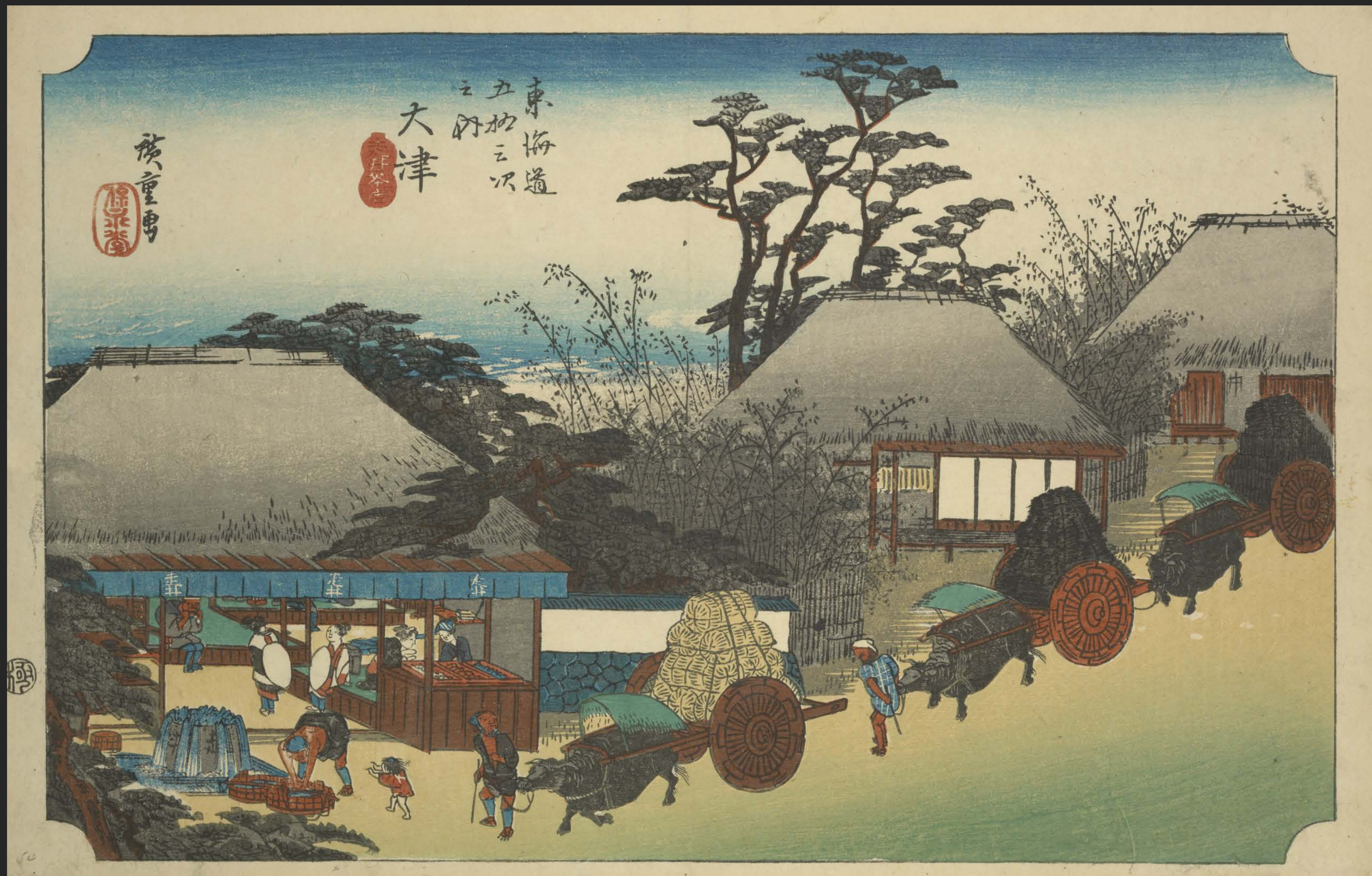
東海道五十三次之内 大津 走井茶店