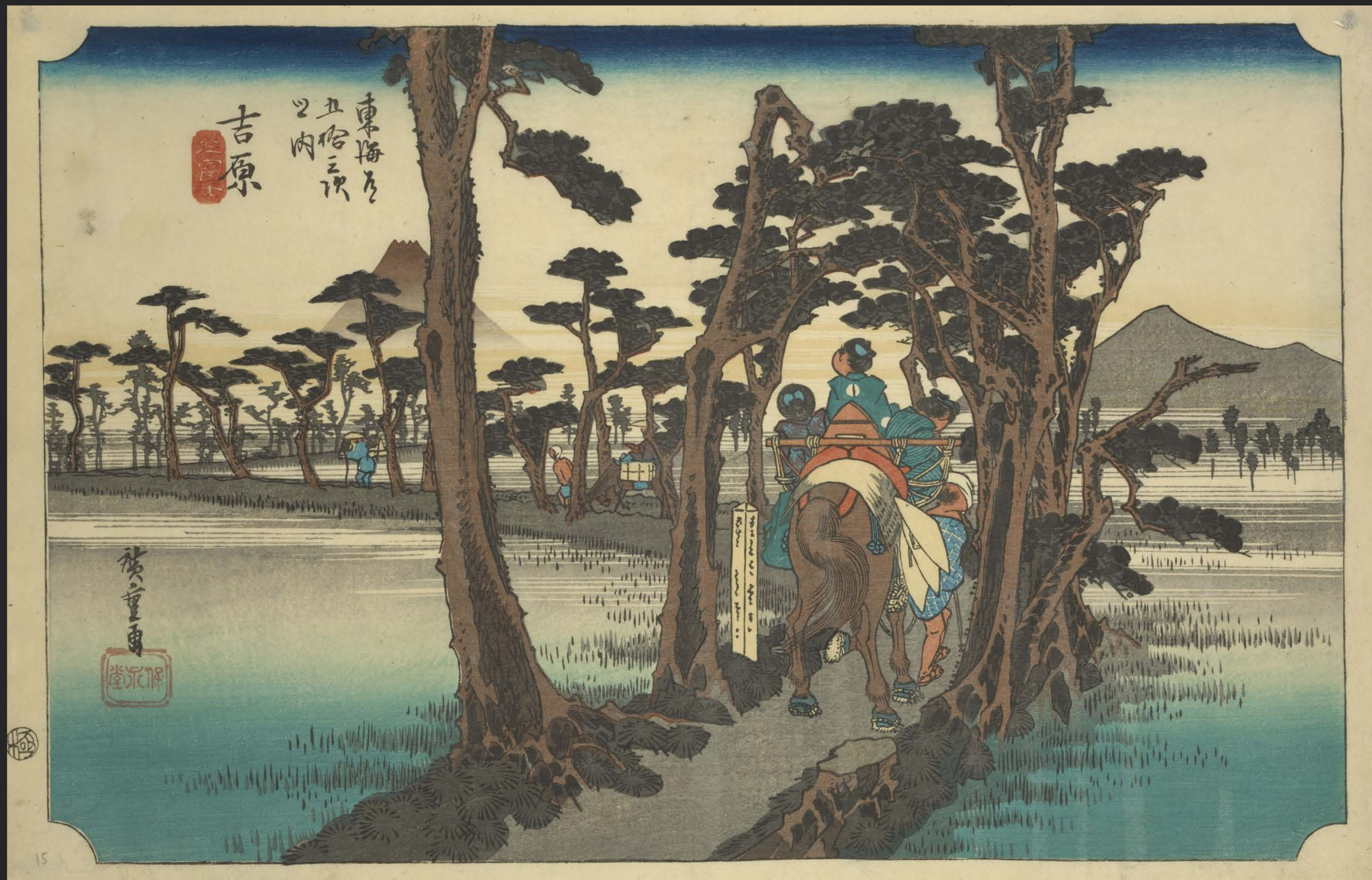
東海道五十三次之内 吉原 左富士