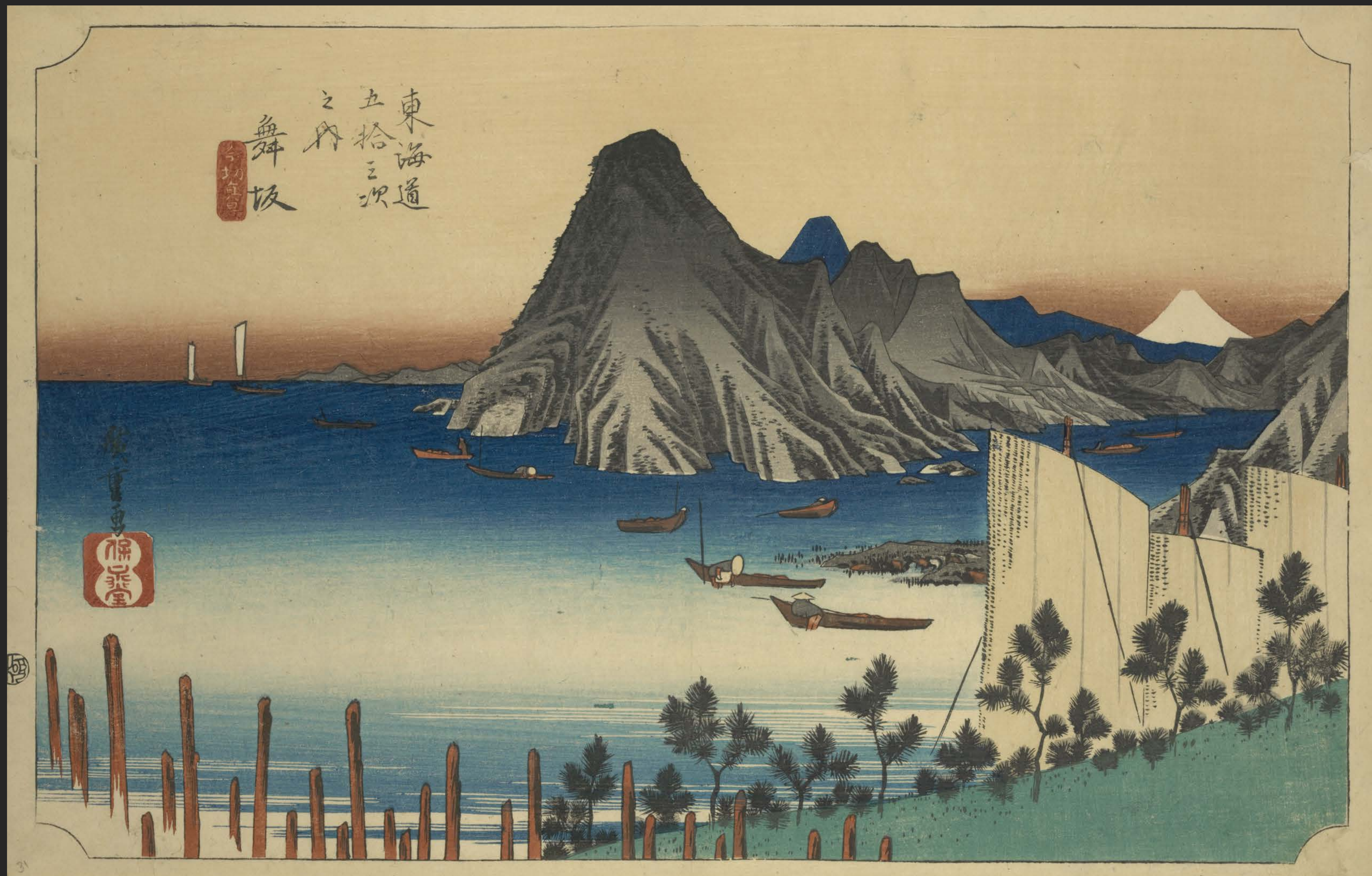
東海道五十三次之内 舞坂 今切真景