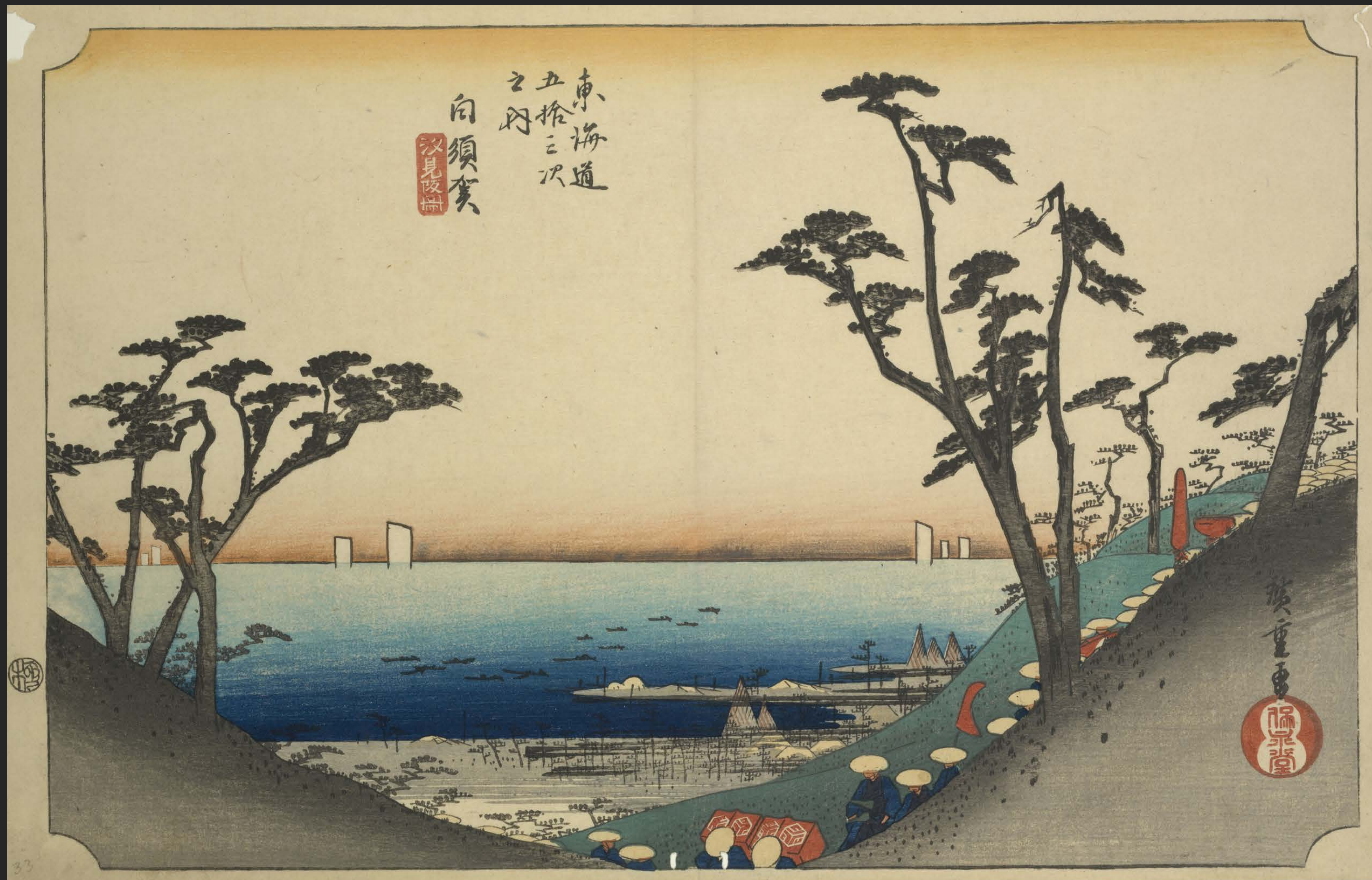
東海道五十三次之内 白須賀 汐見阪図