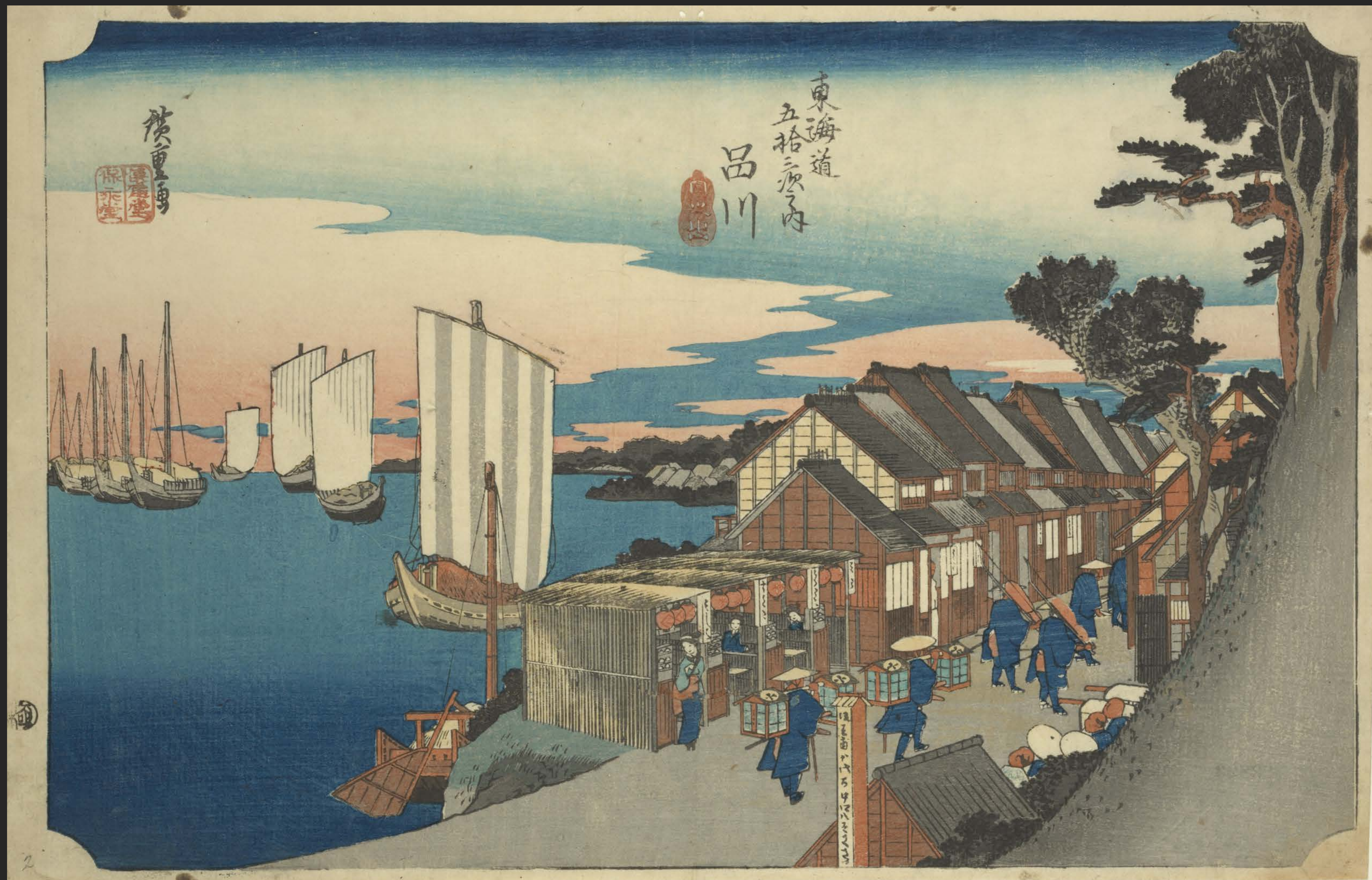
東海道五十三次之内 品川 日之出