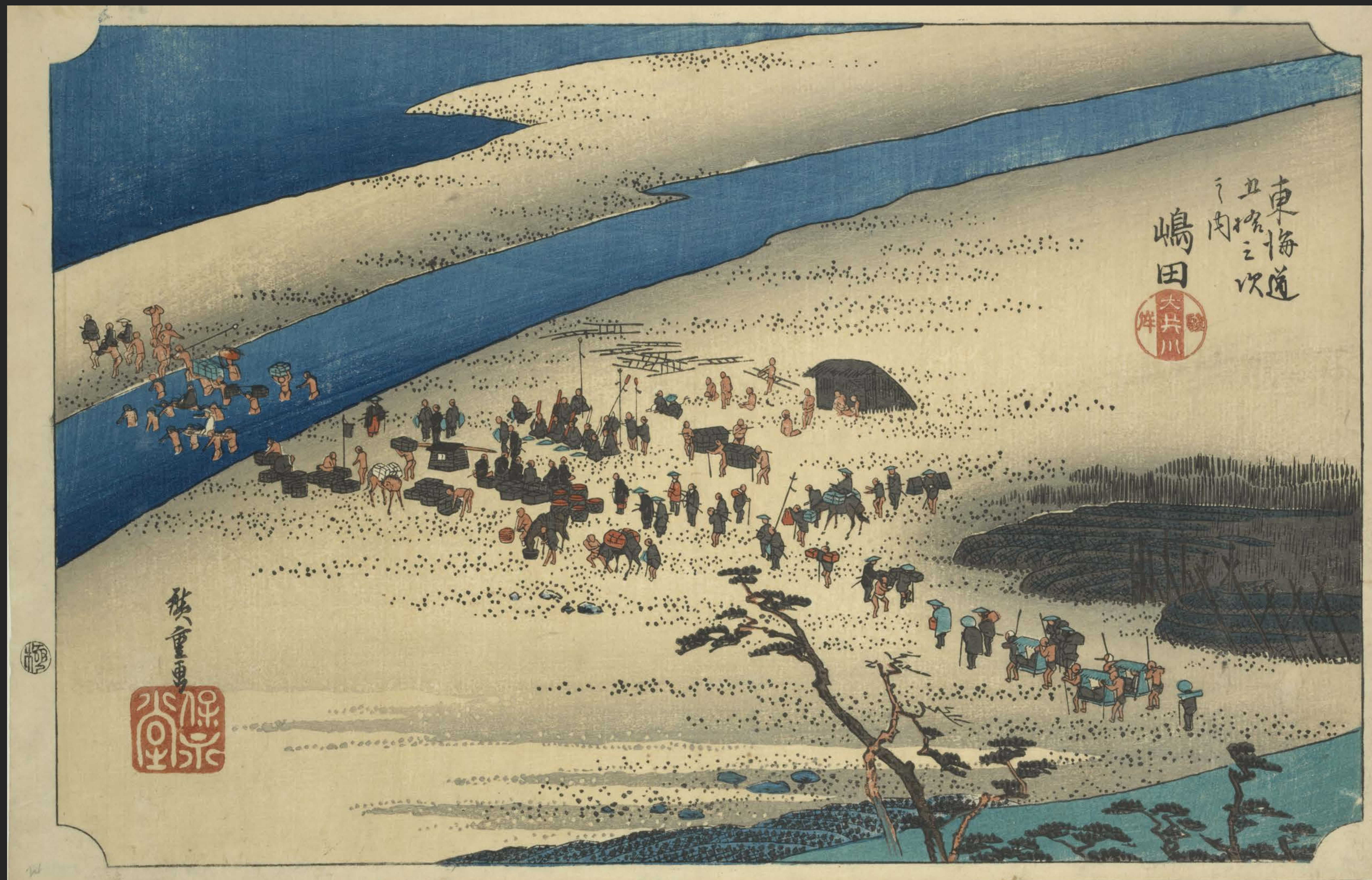
東海道五十三次之内 嶋田 大井川駿岸