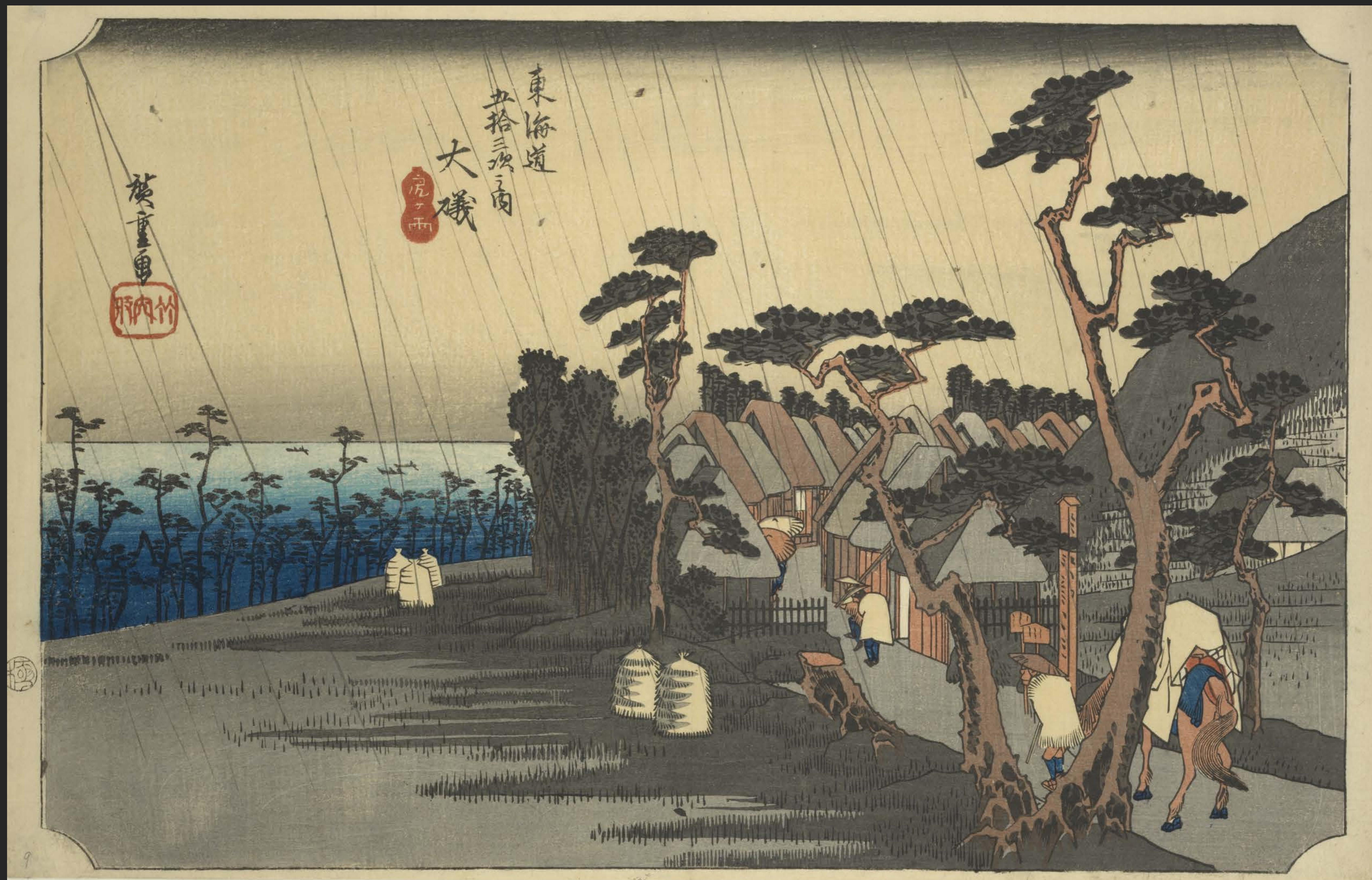
東海道五十三次之内 大磯 虎ヶ雨