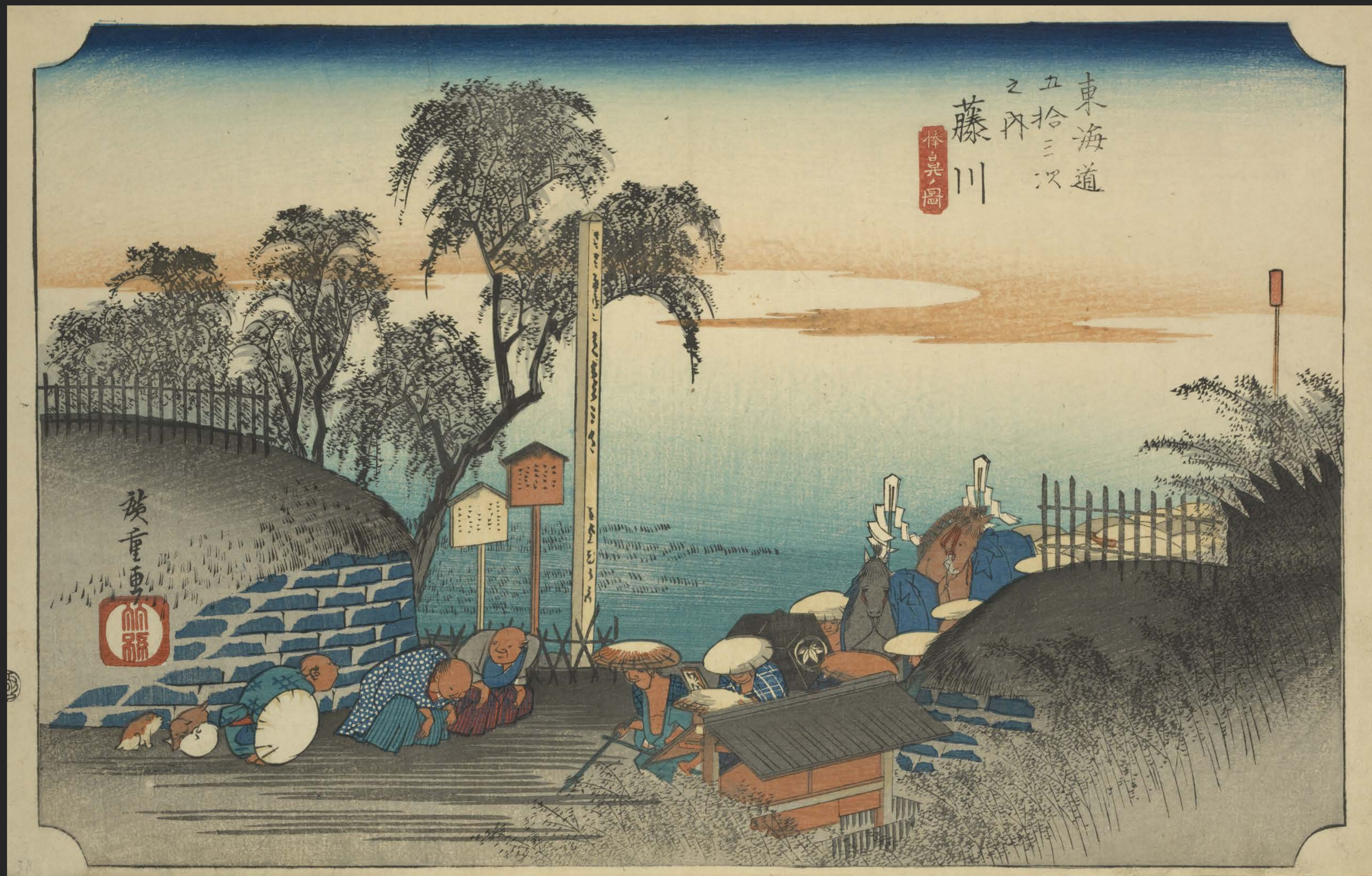
東海道五十三次之内 藤川 棒鼻ノ図