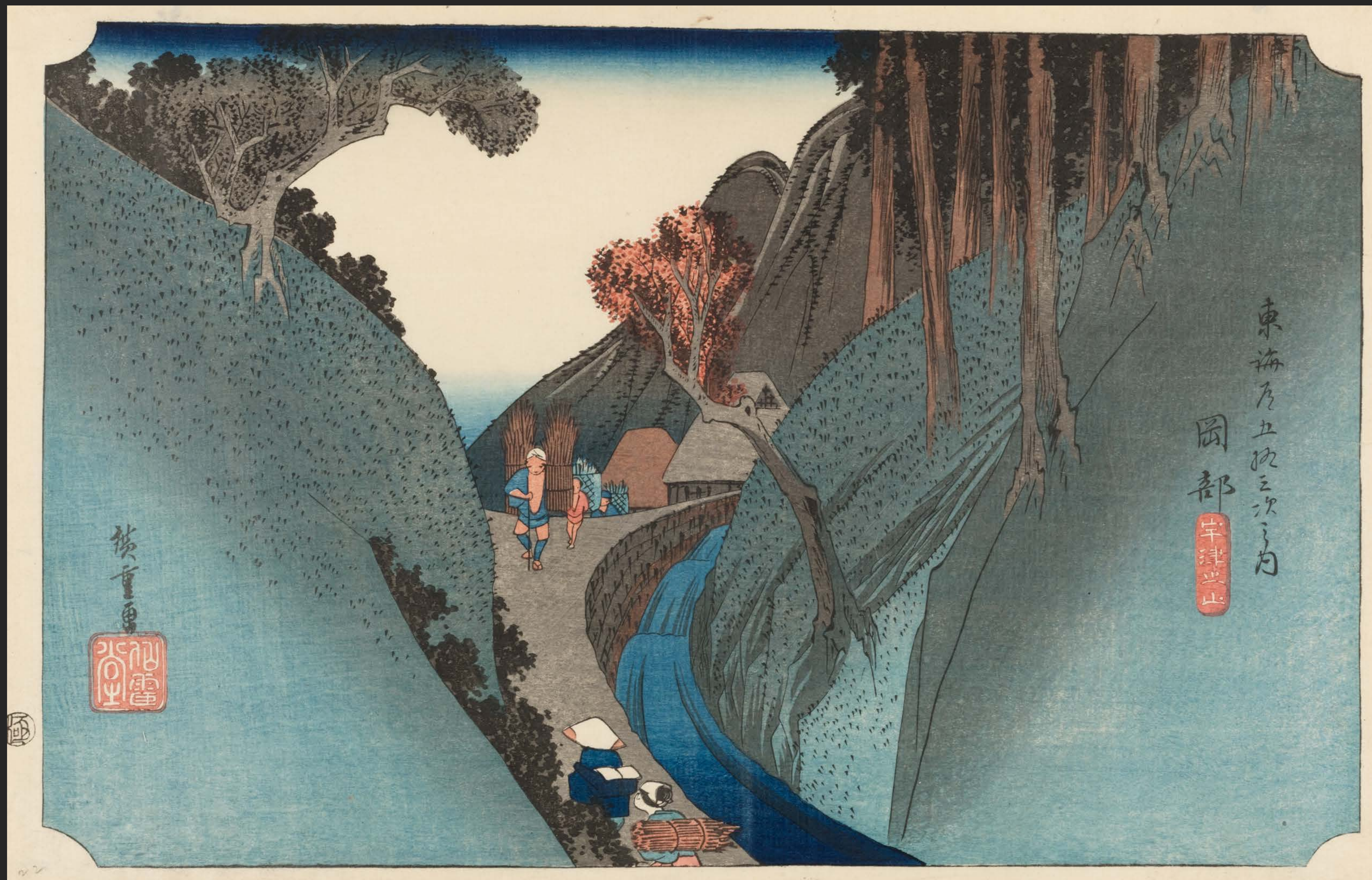
東海道五十三次之内 岡部 宇津之山