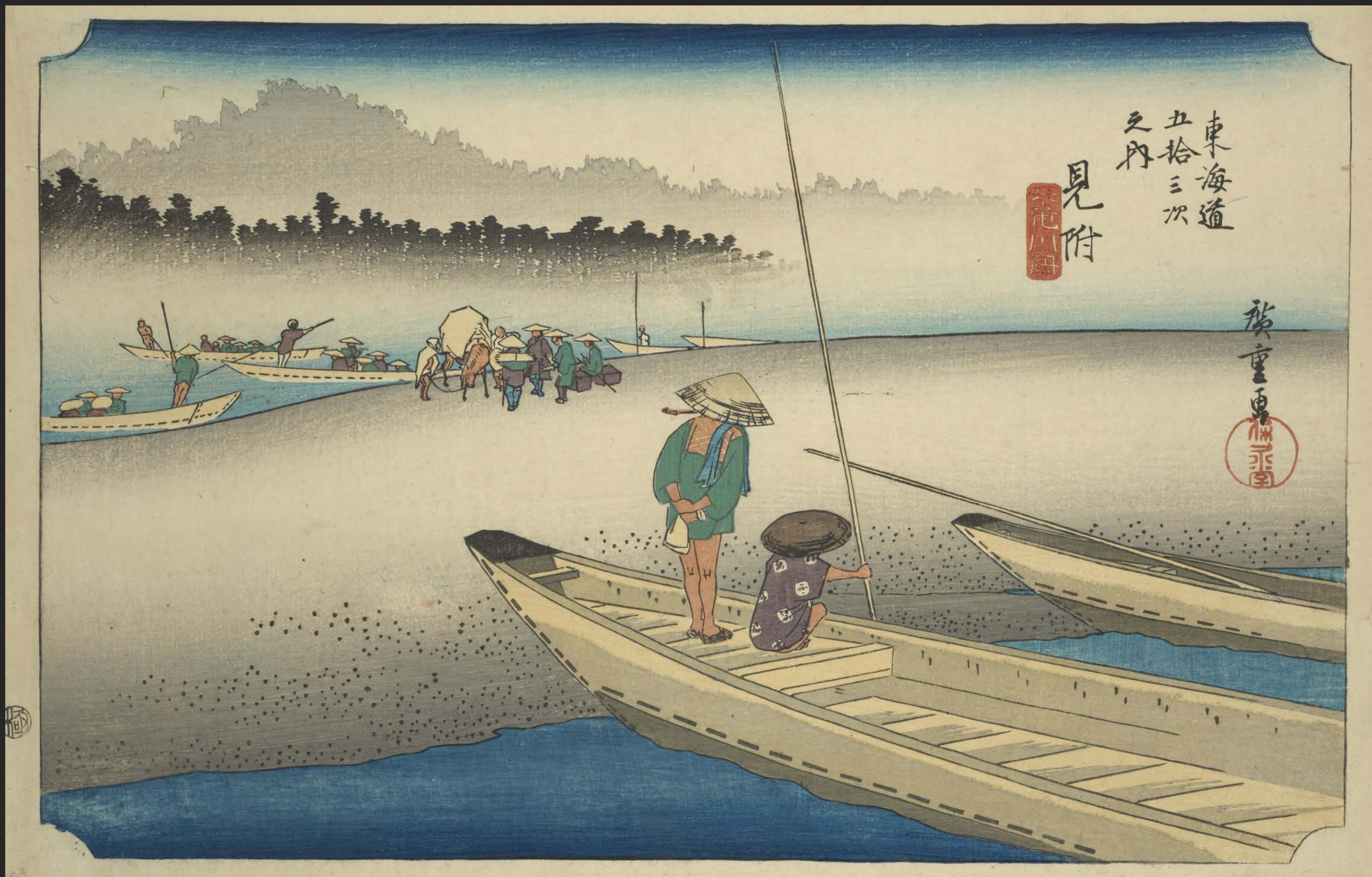
東海道五十三次之内 見附 天竜川図