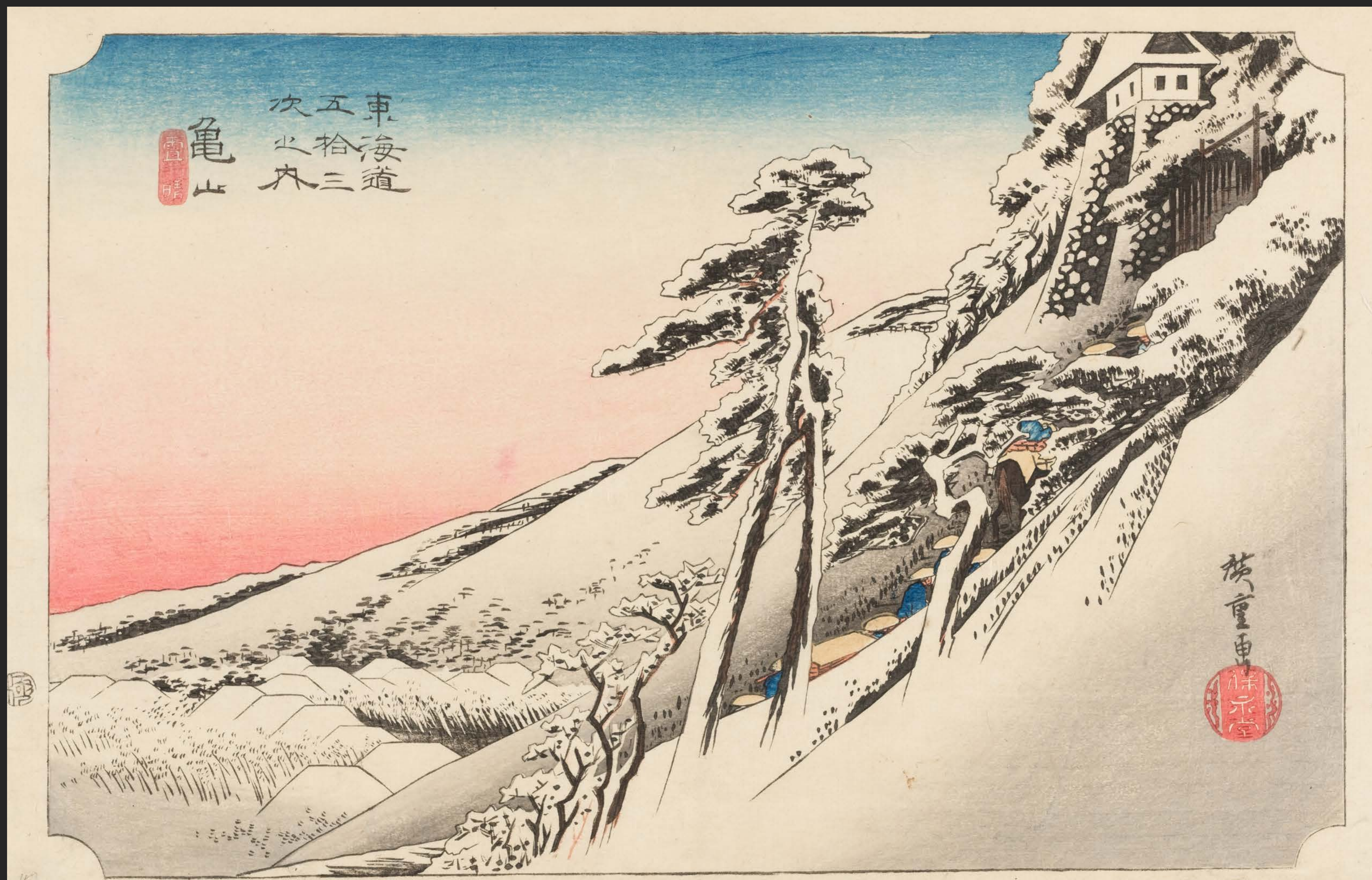
東海道五十三次之内 龜山 雪晴