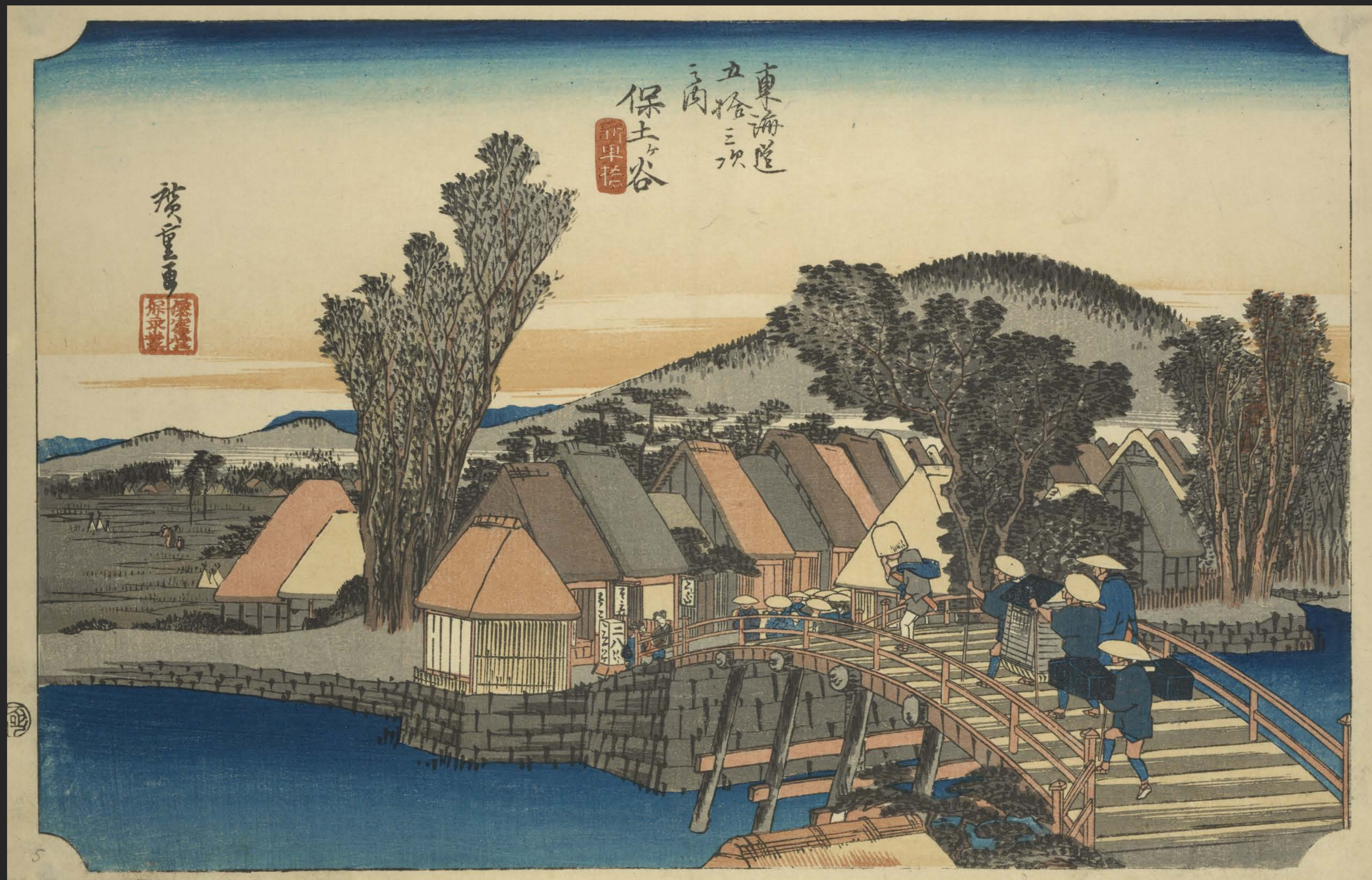
東海道五十三次之内 保土ヶ谷 新町橋