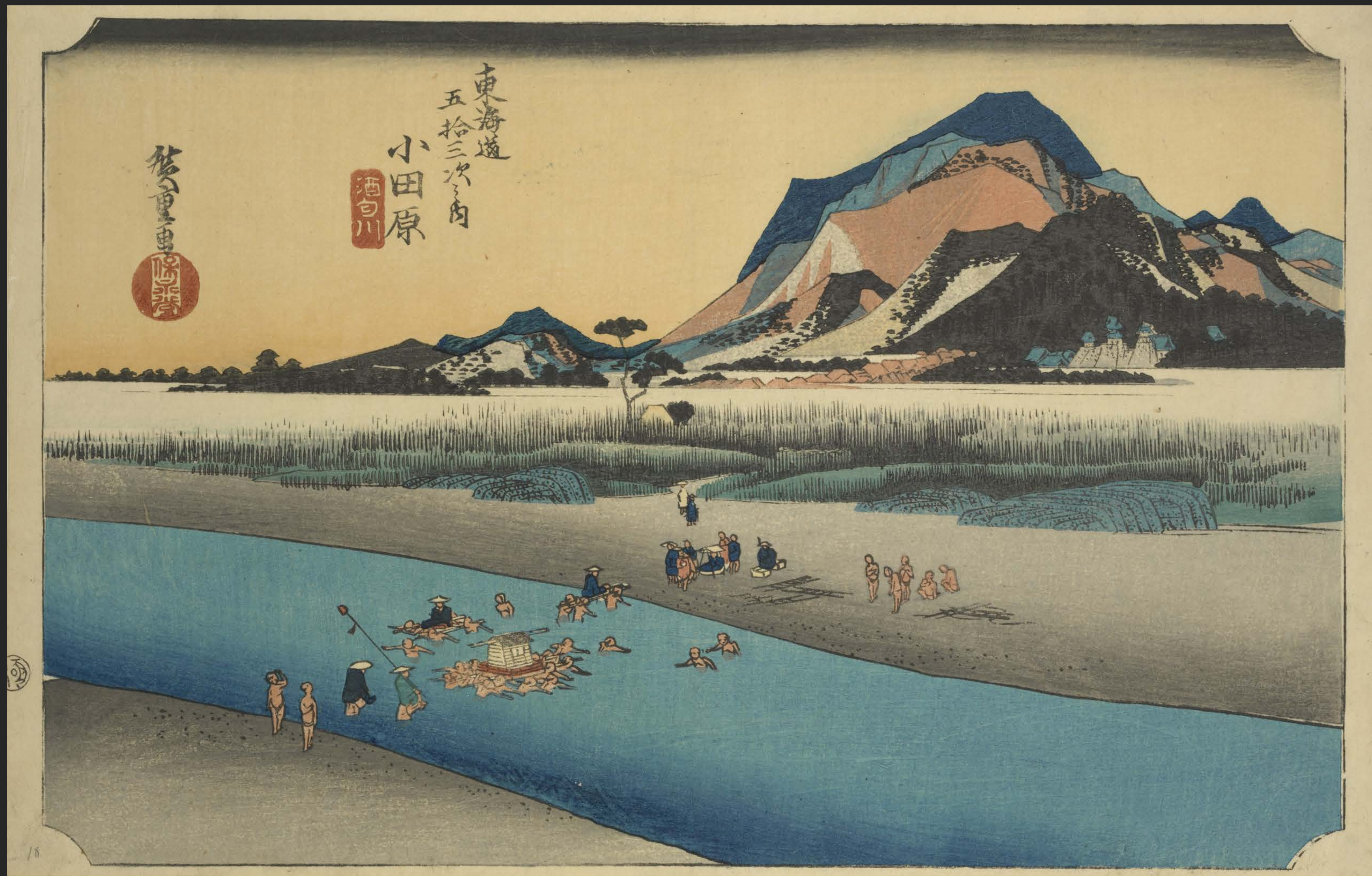
東海道五十三次之内 小田原 酒匂川