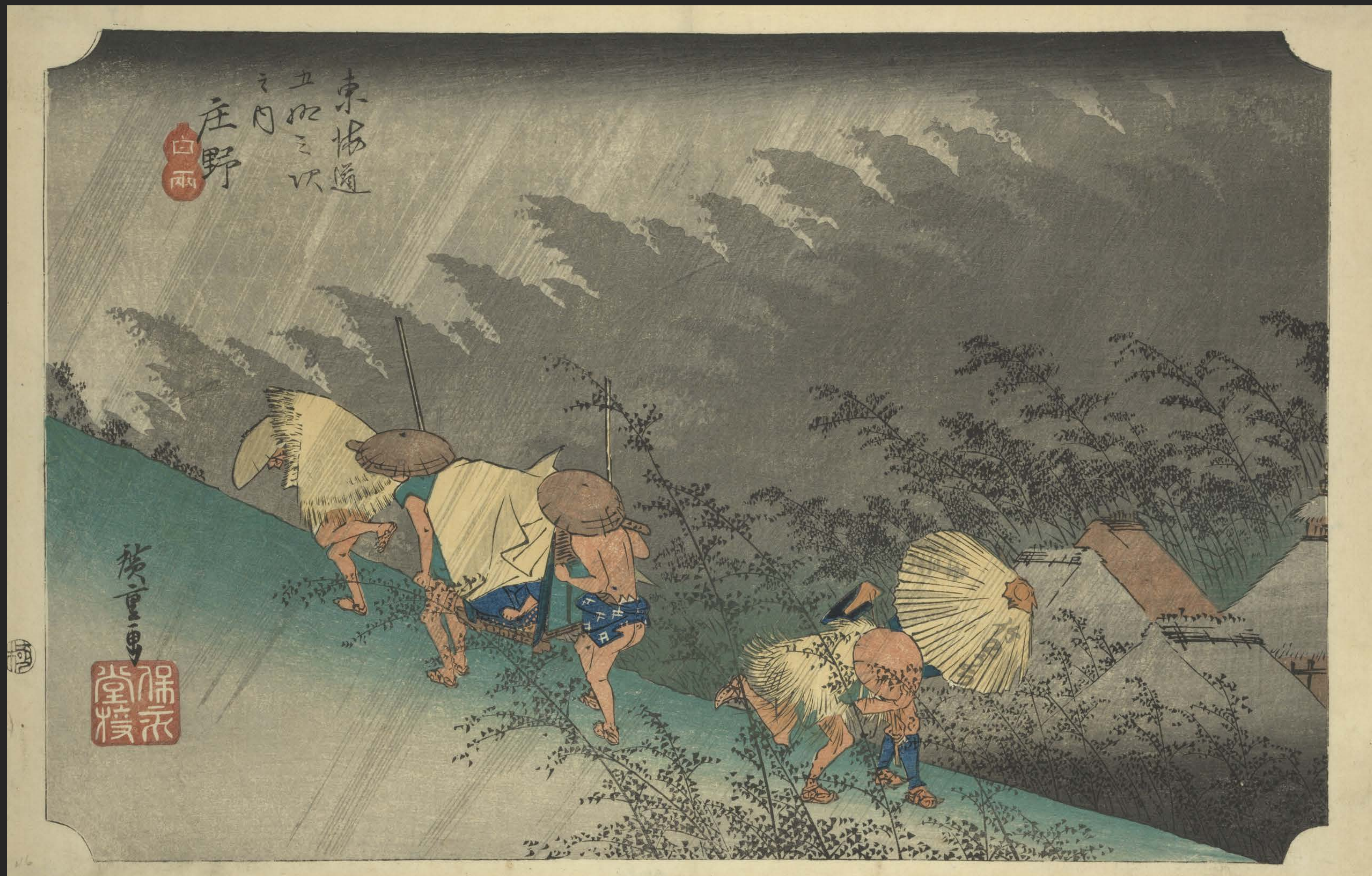
東海道五十三次之内 庄野 白雨