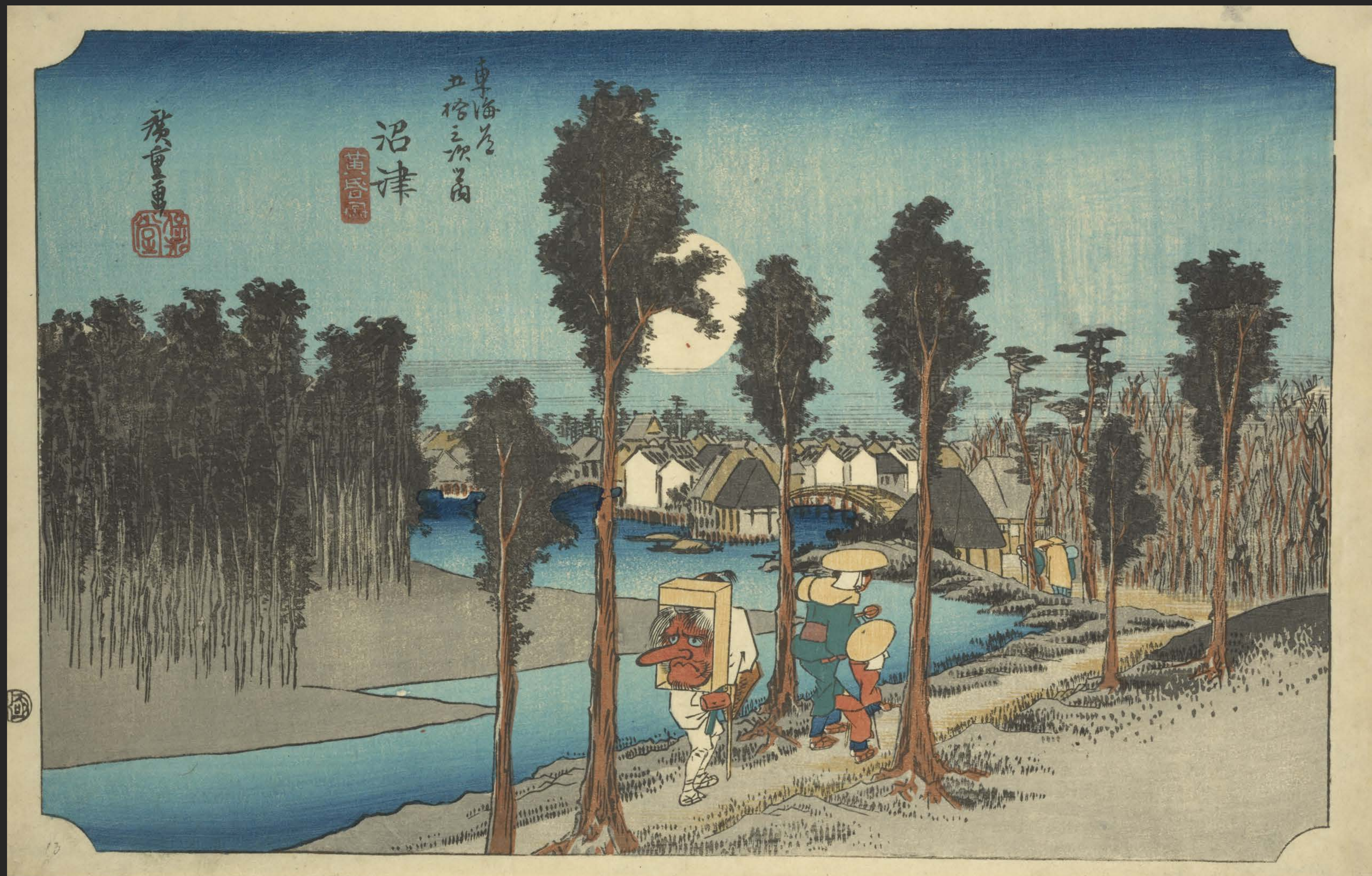
東海道五十三次之内 沼津 黄昏図