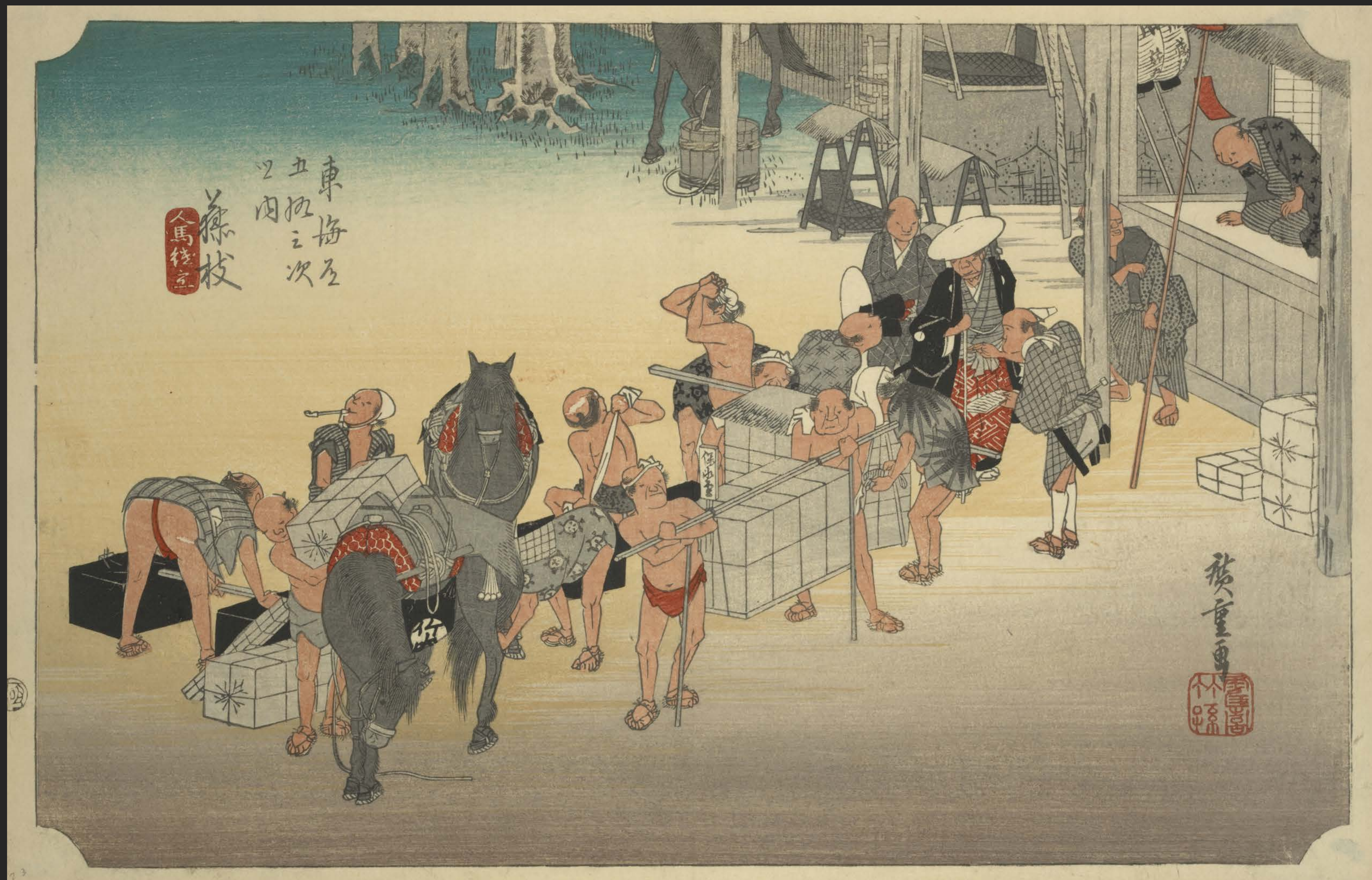
東海道五十三次之内 藤枝 人馬継立