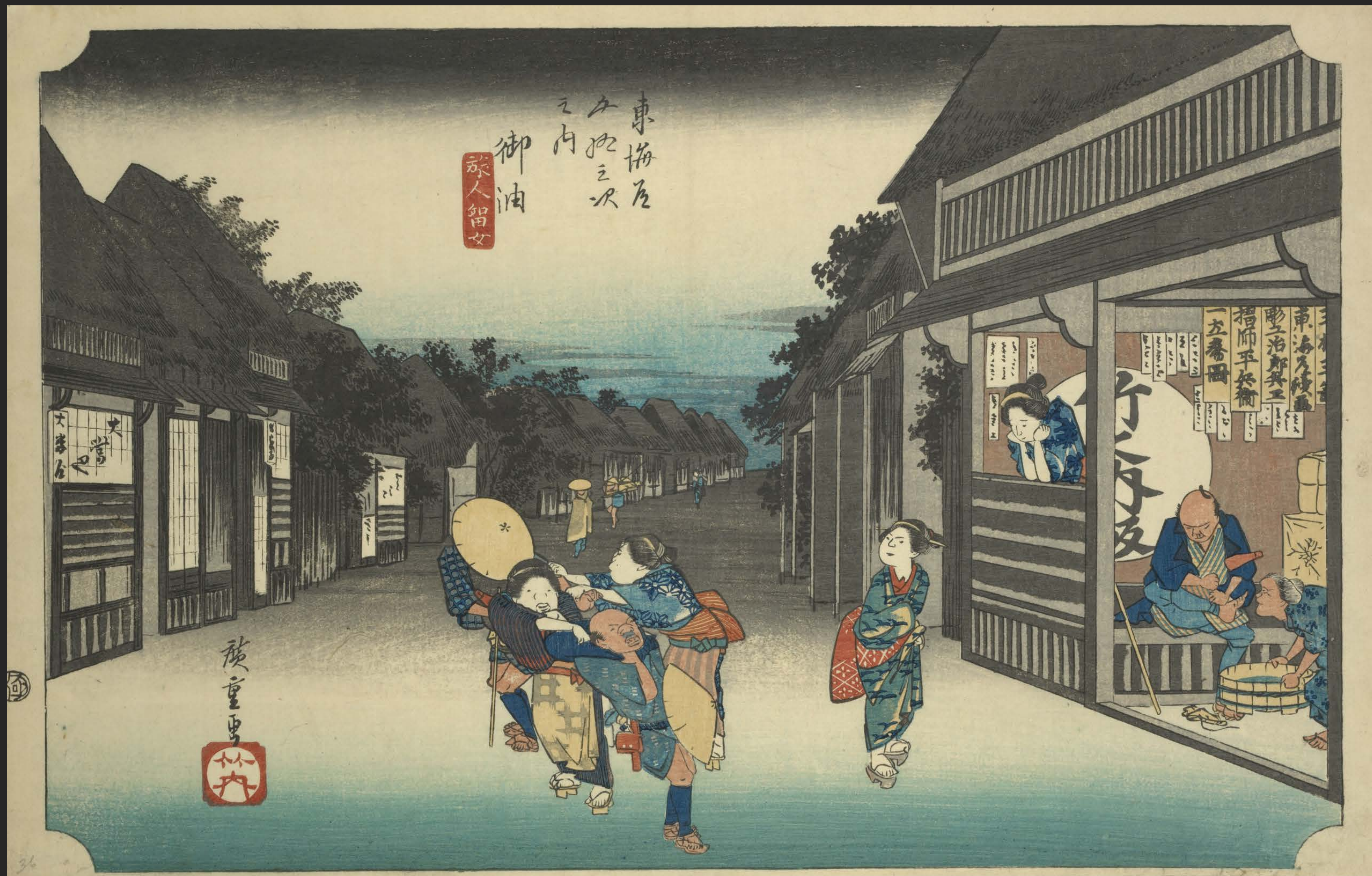
東海道五十三次之内 御油 旅人留女