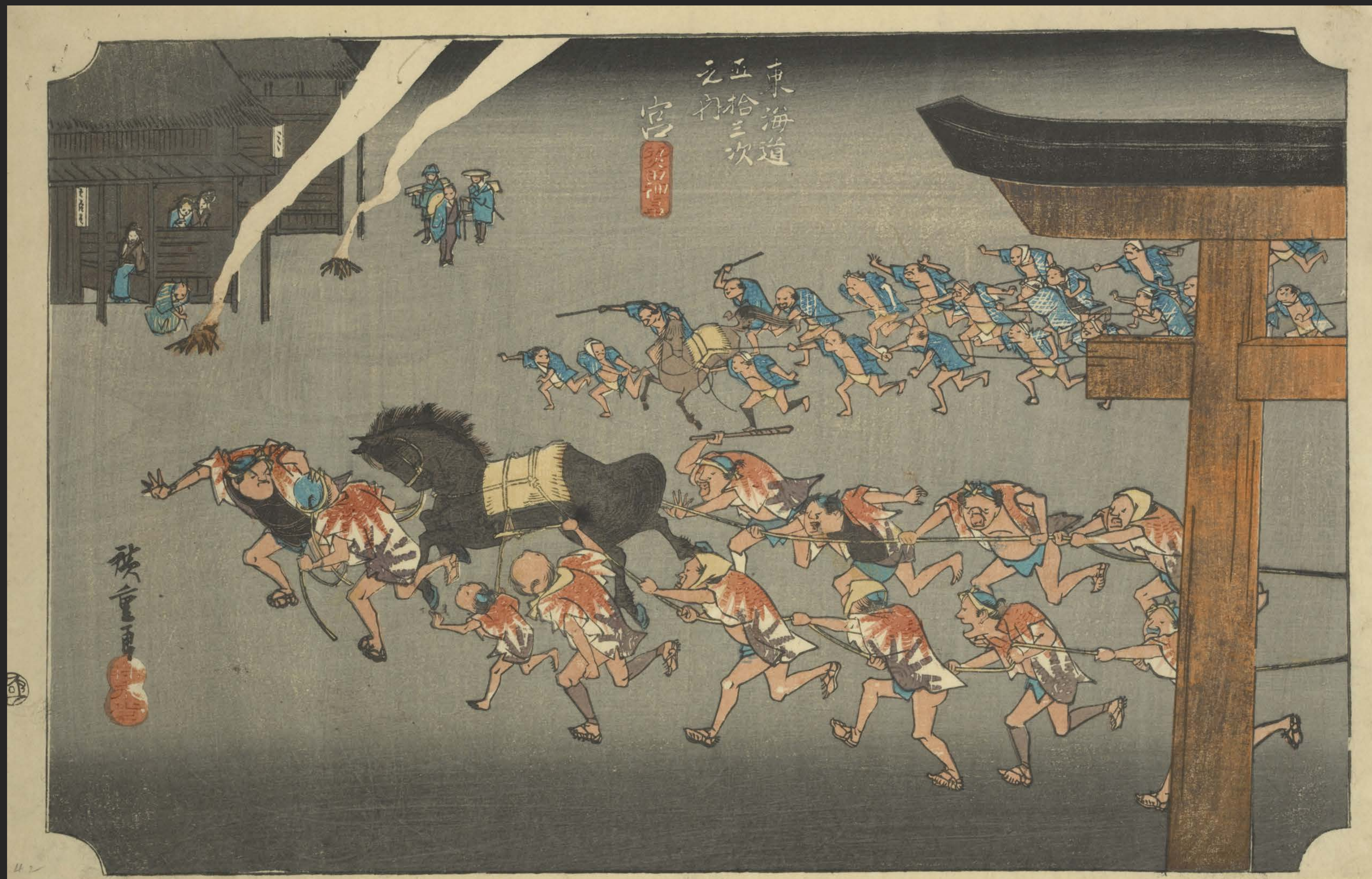
東海道五十三次之内 宮 熱田神事