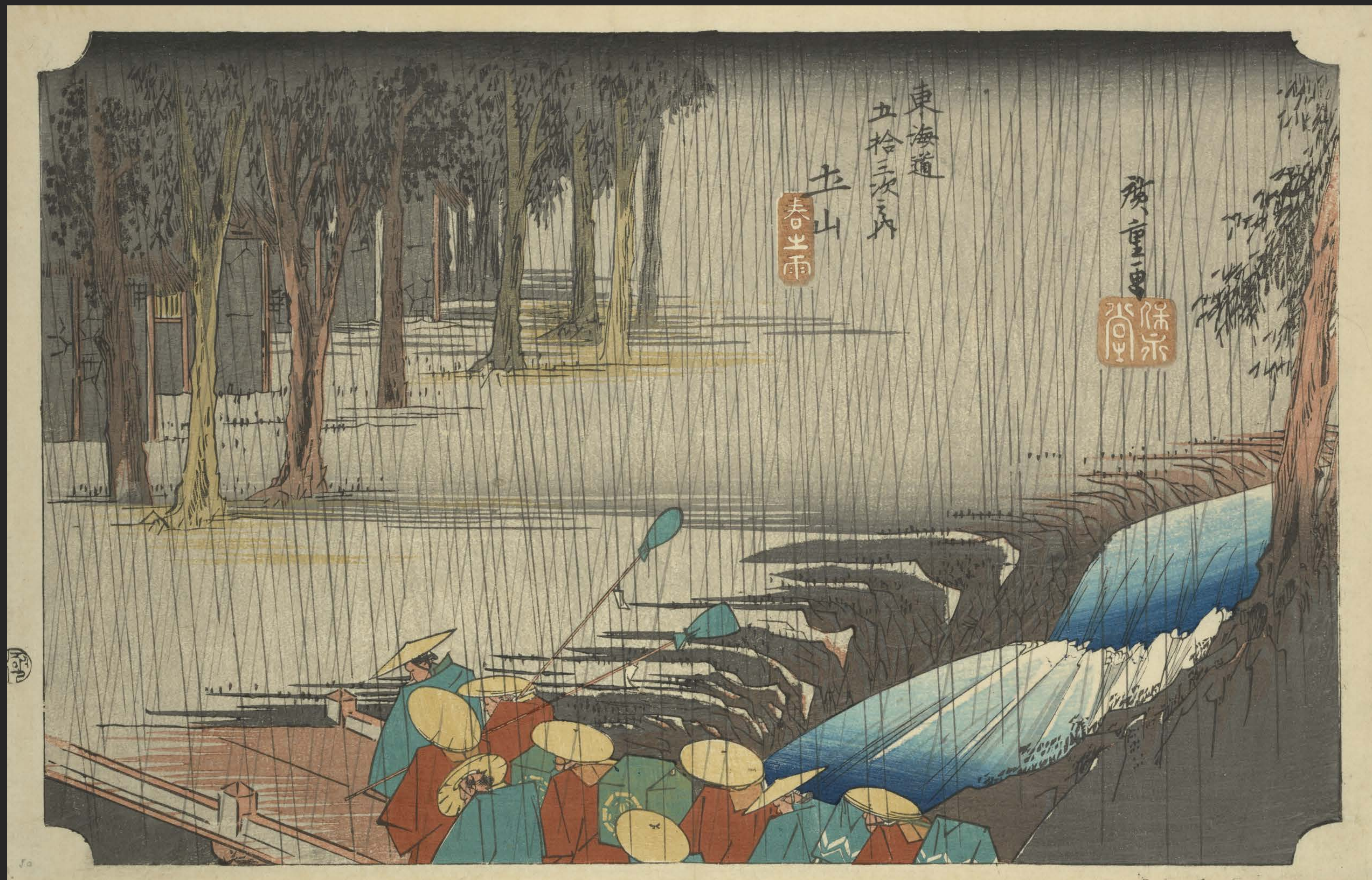
東海道五十三次之内 土山 春之雨