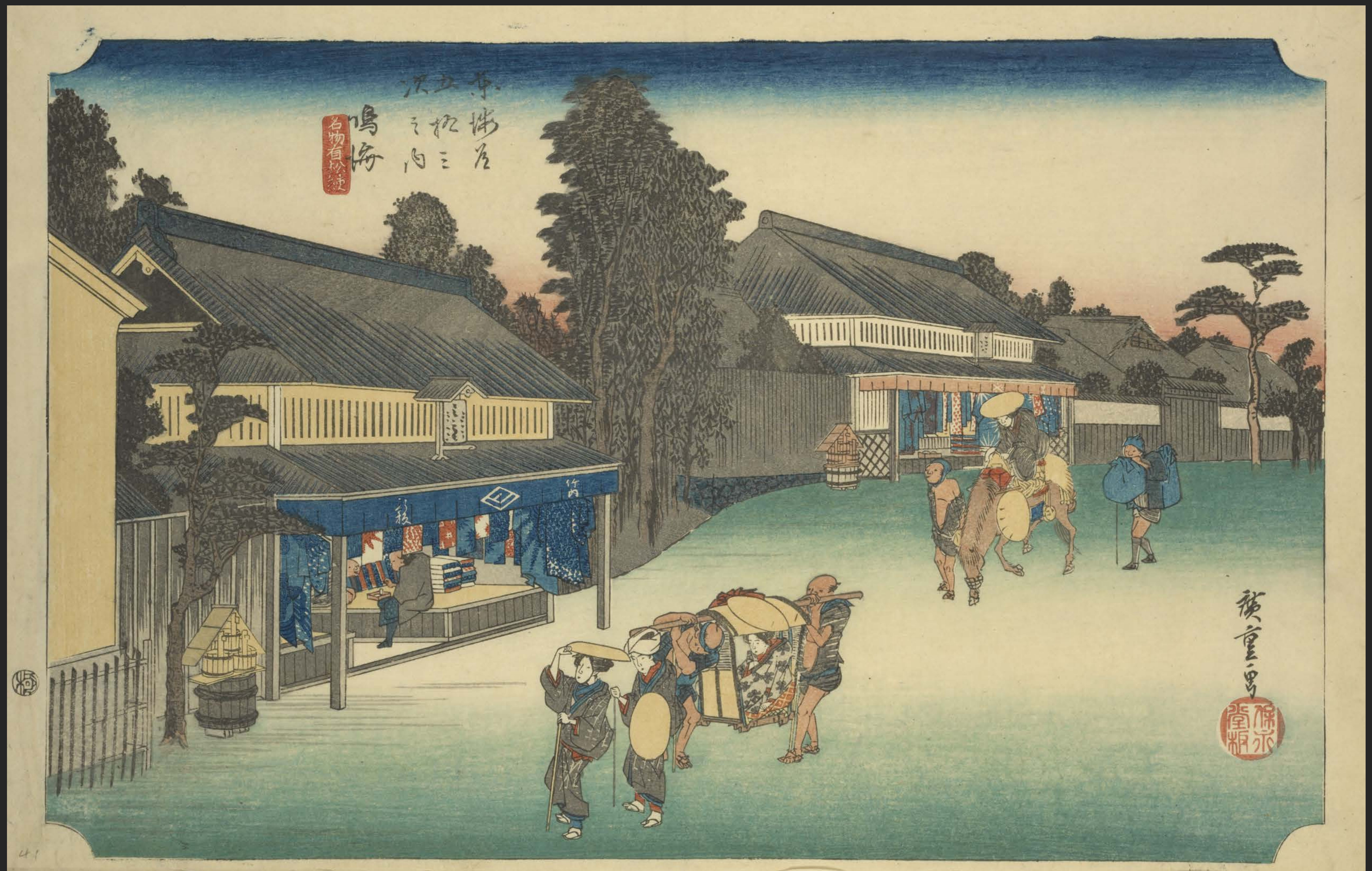
東海道五十三次之内 鳴海 名物有松紋