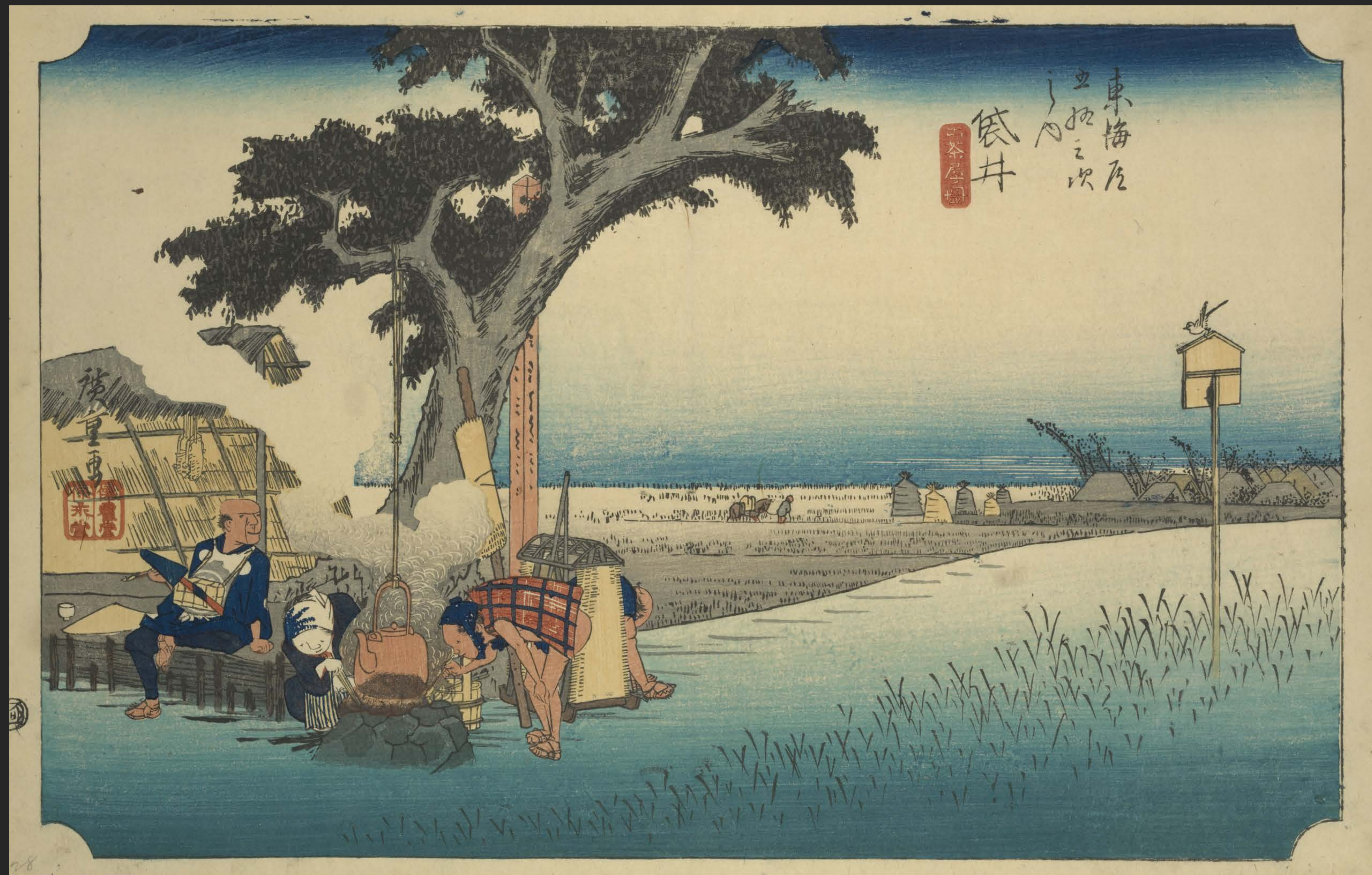
東海道五十三次之内 袋井 出茶屋ノ図