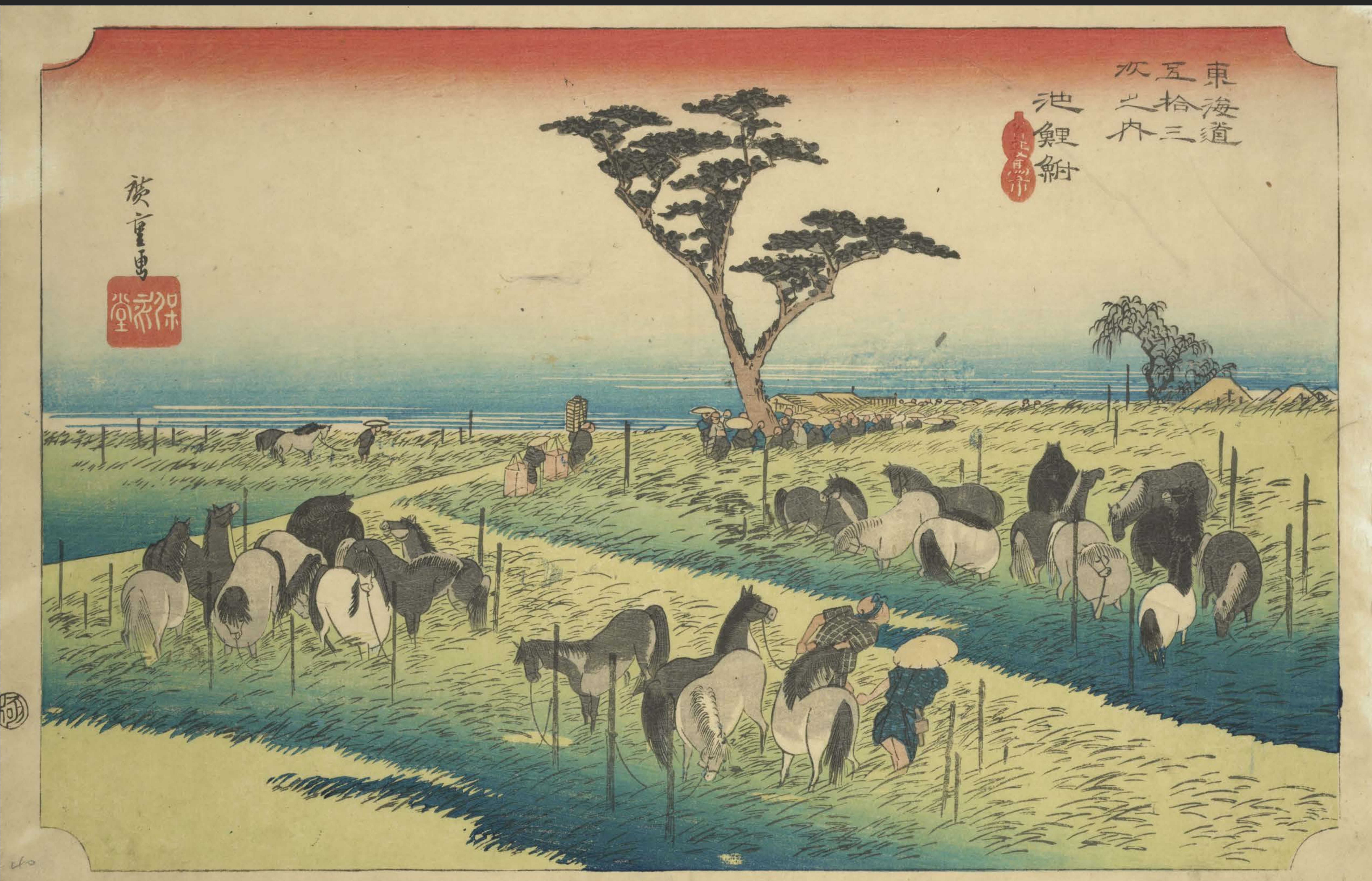
東海道五十三次之内 池鯉鮒 馬市