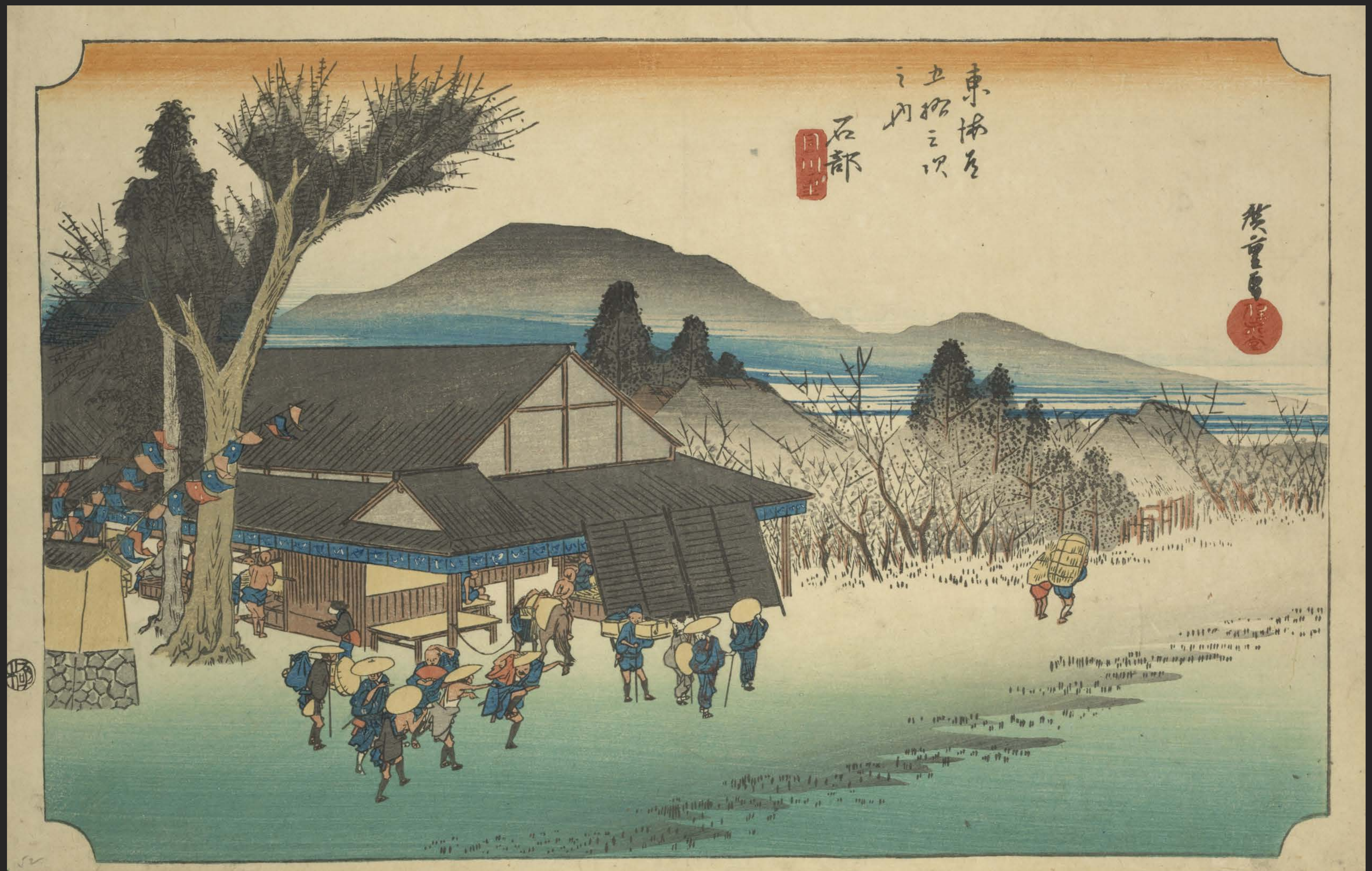
東海道五十三次之内 石部 目川ノ里