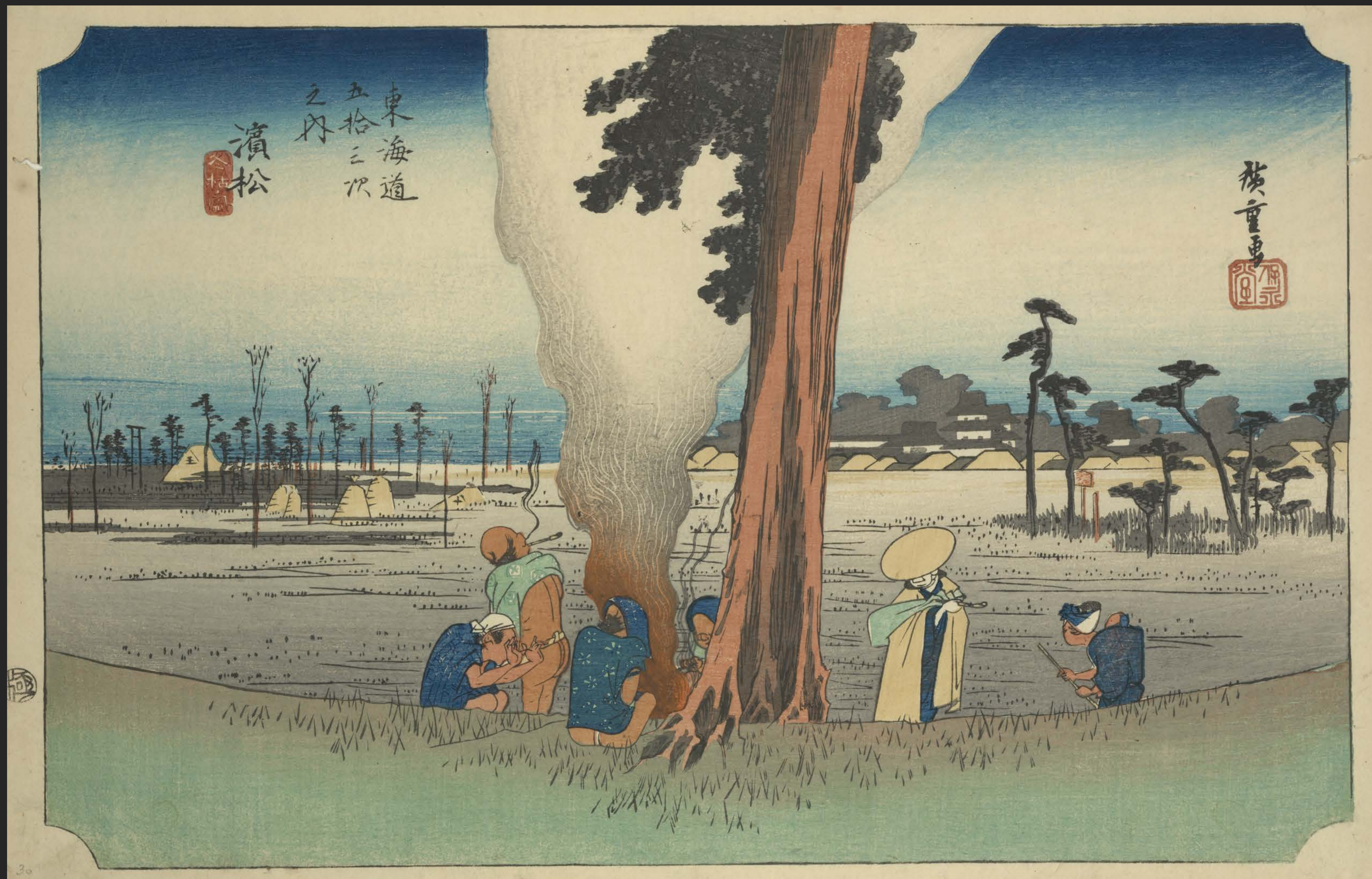
東海道五十三次之内 濱松 冬枯ノ図