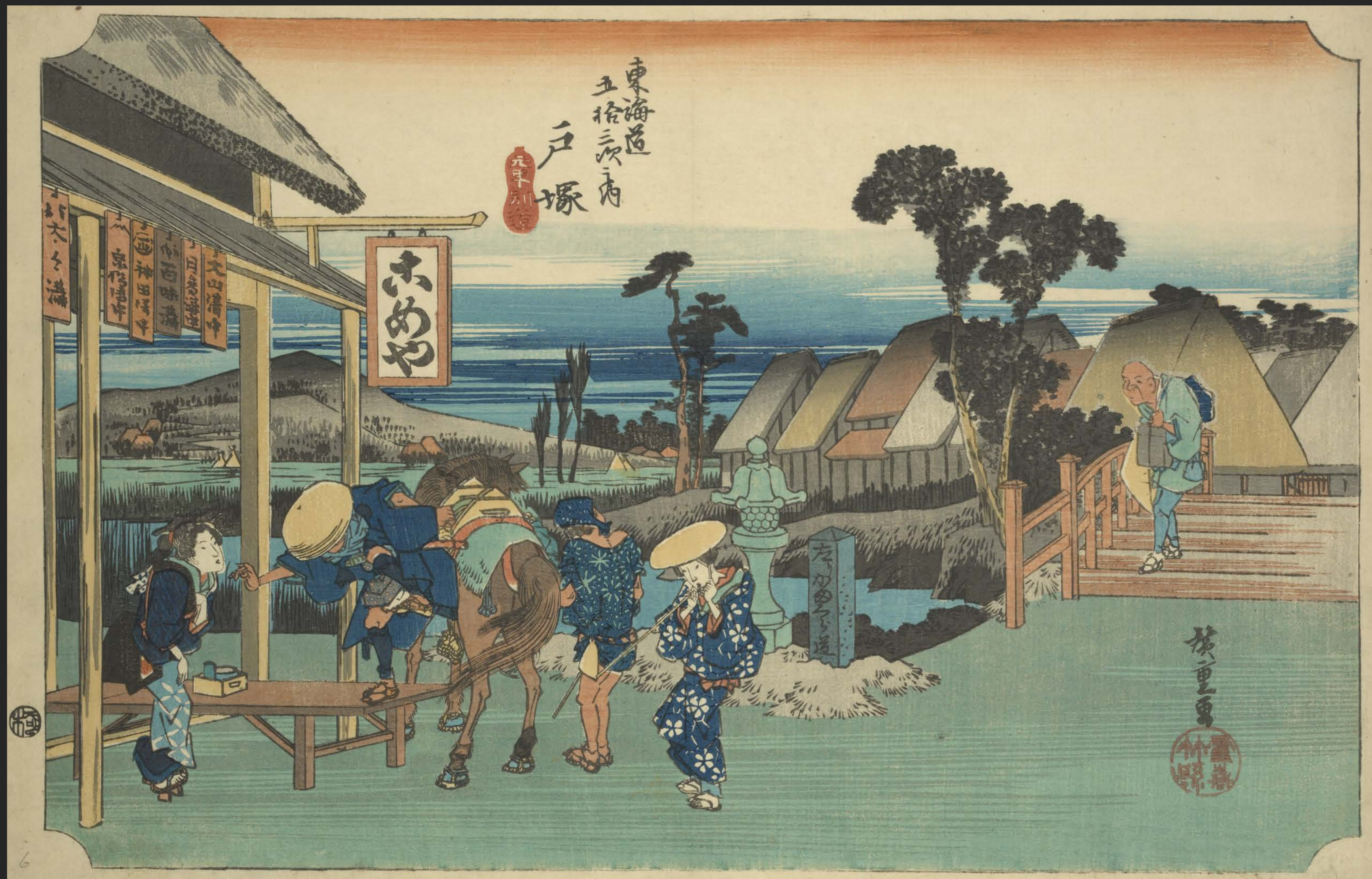
東海道五十三次之内 戸塚 元町別道