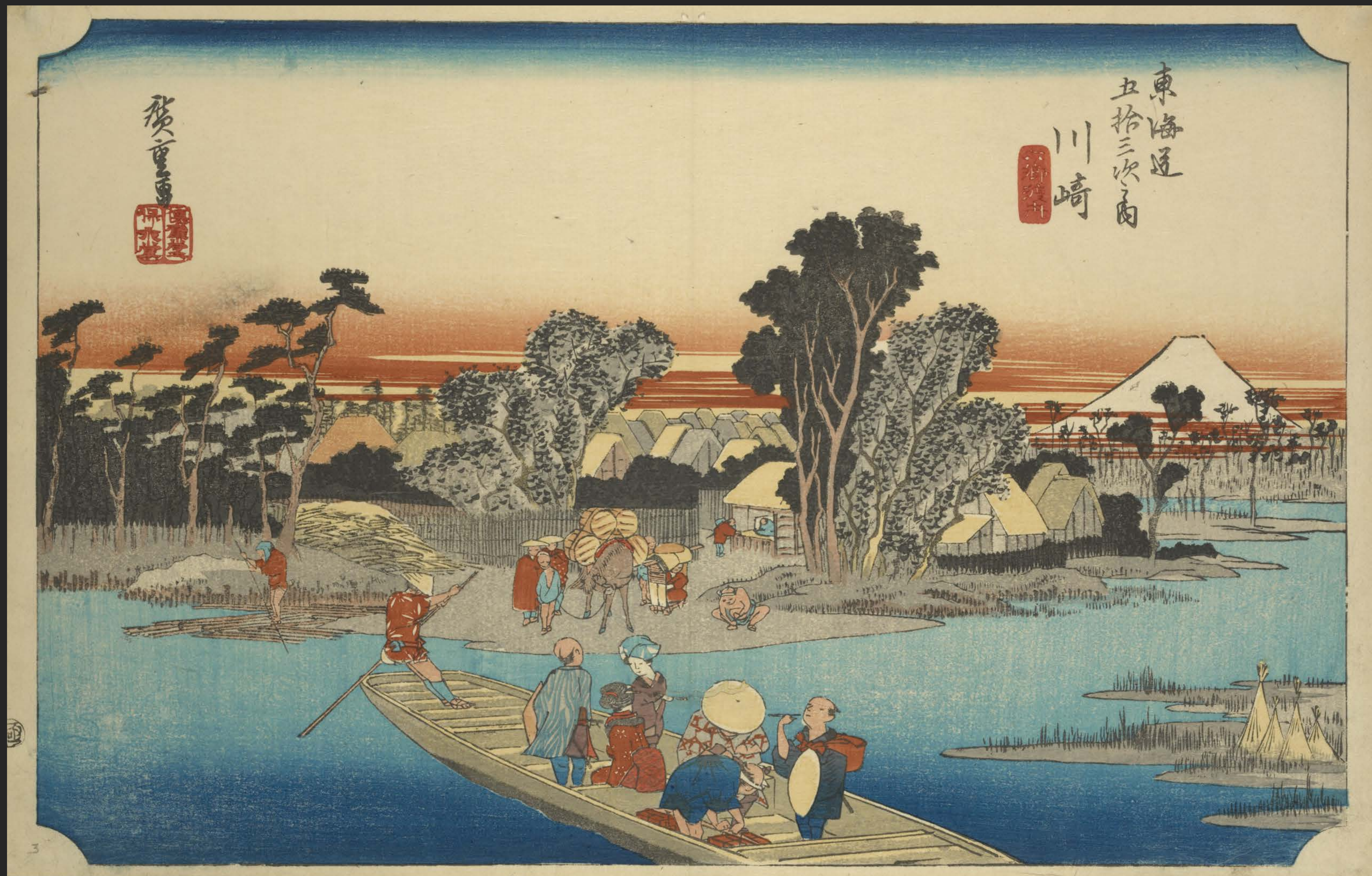
東海道五十三次之内 川崎 六郷渡舟