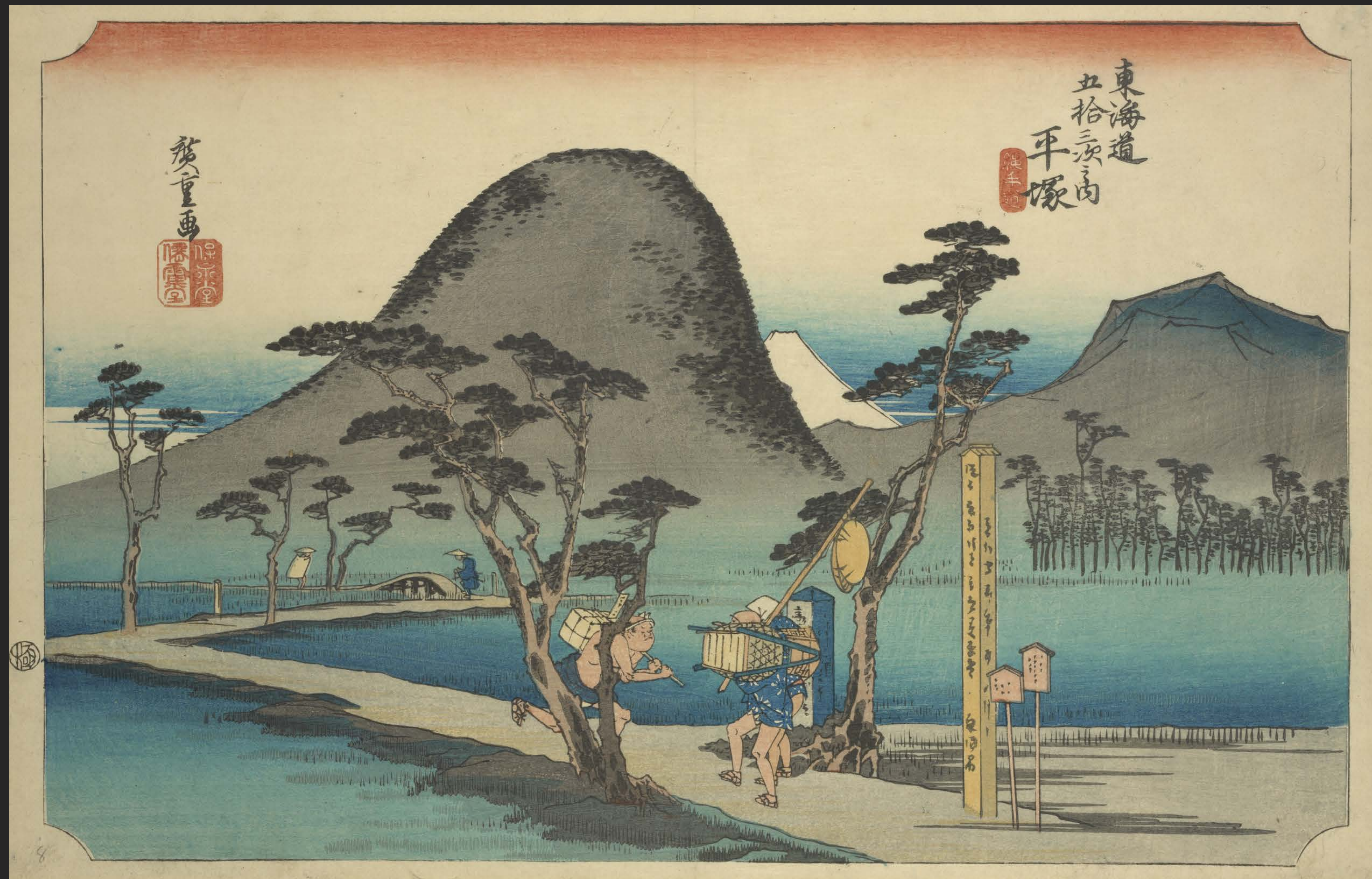
東海道五十三次之内 平塚 縄手道