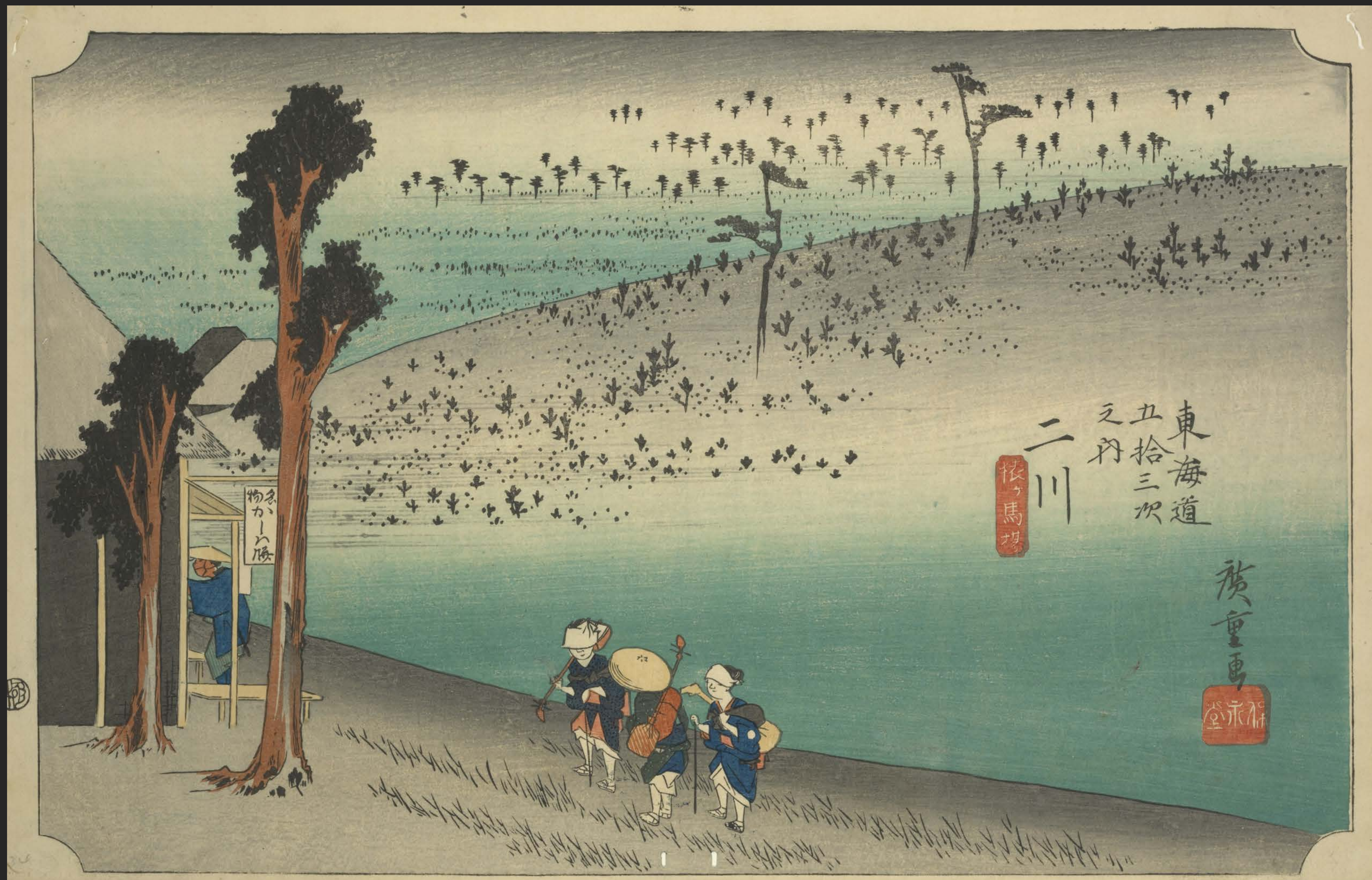
東海道五十三次之内 二川 猿ヶ馬場