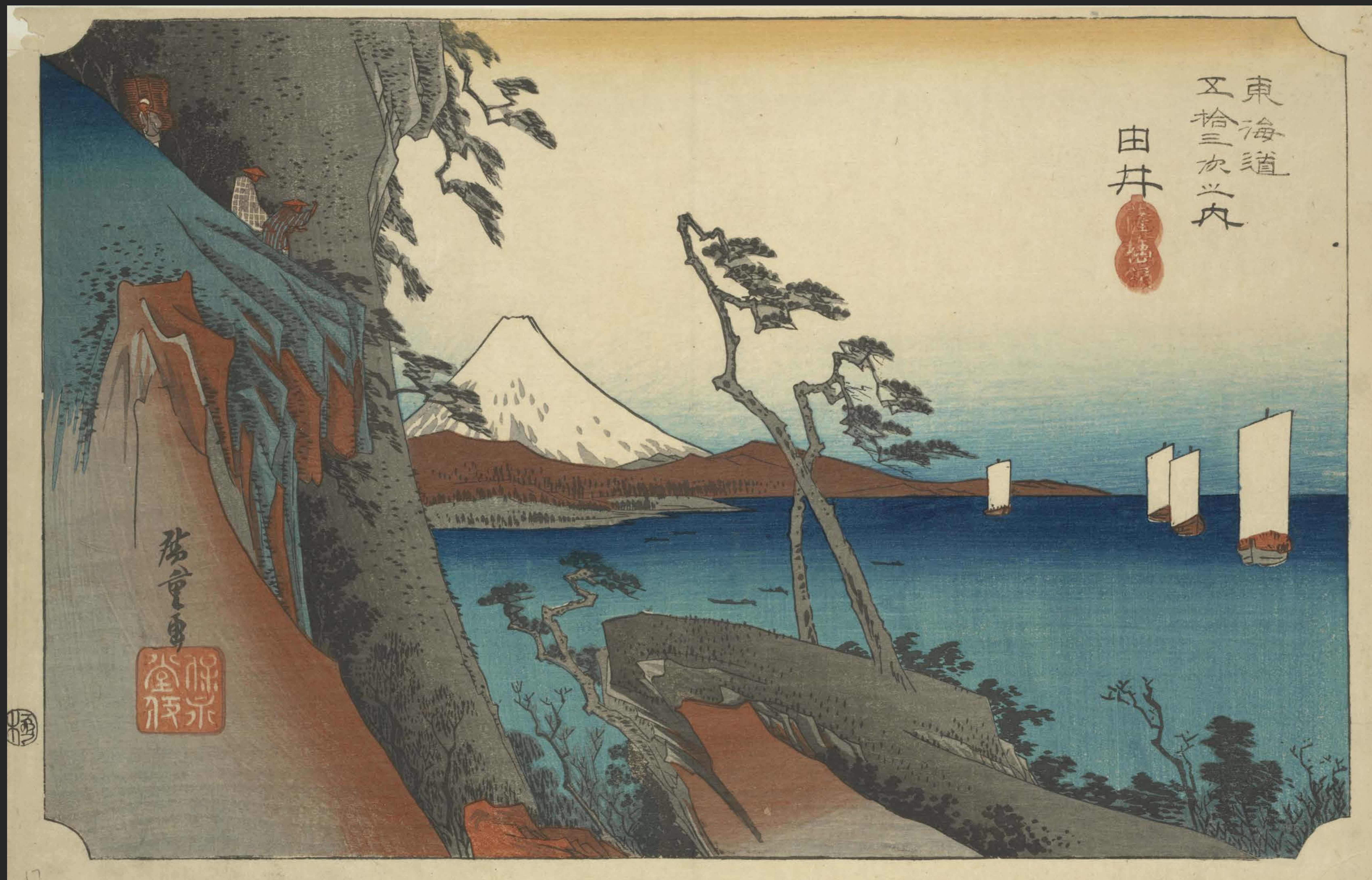
東海道五十三次之内 由井 薩埵嶺