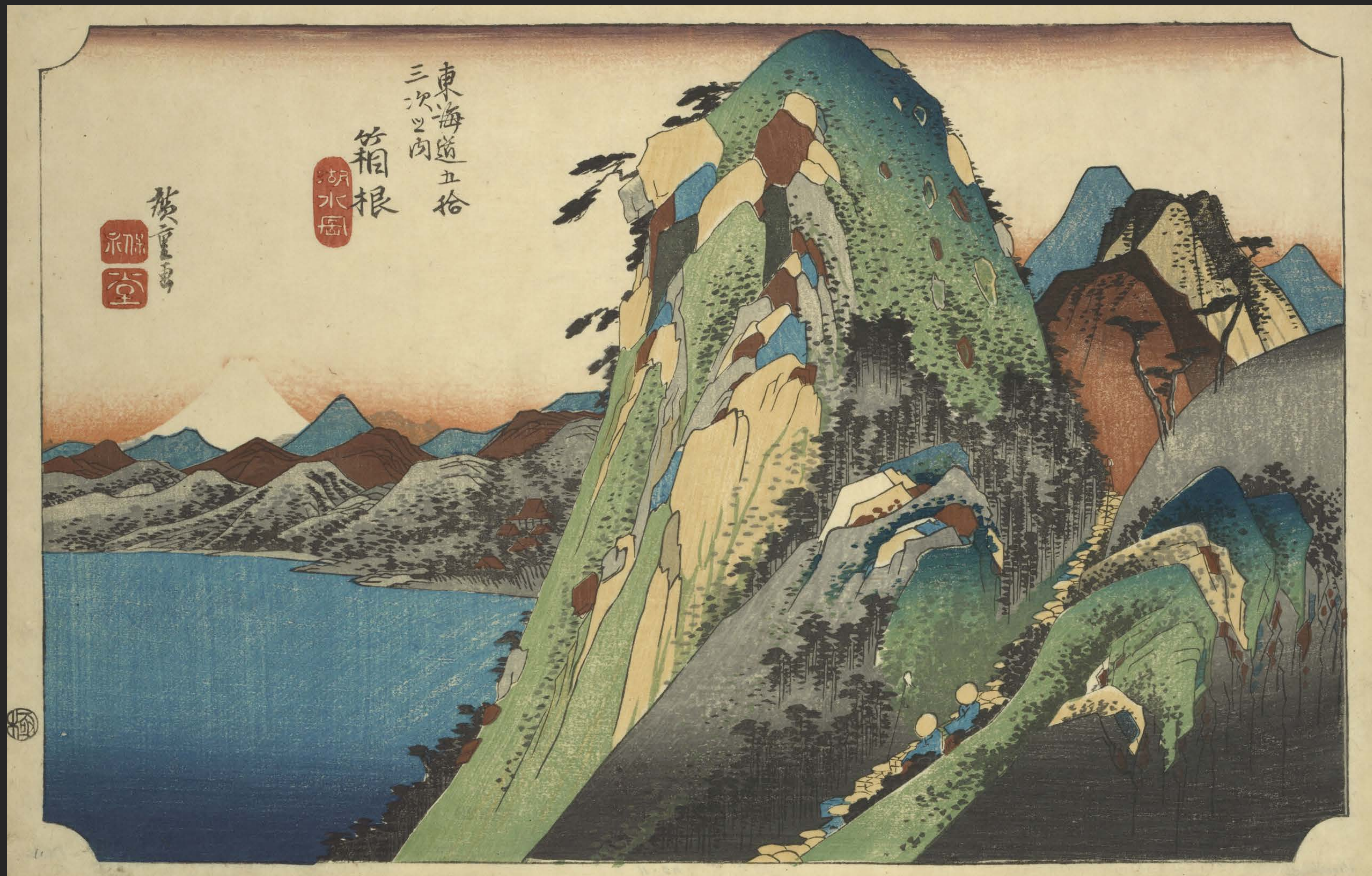
東海道五十三次之内 箱根 湖水図