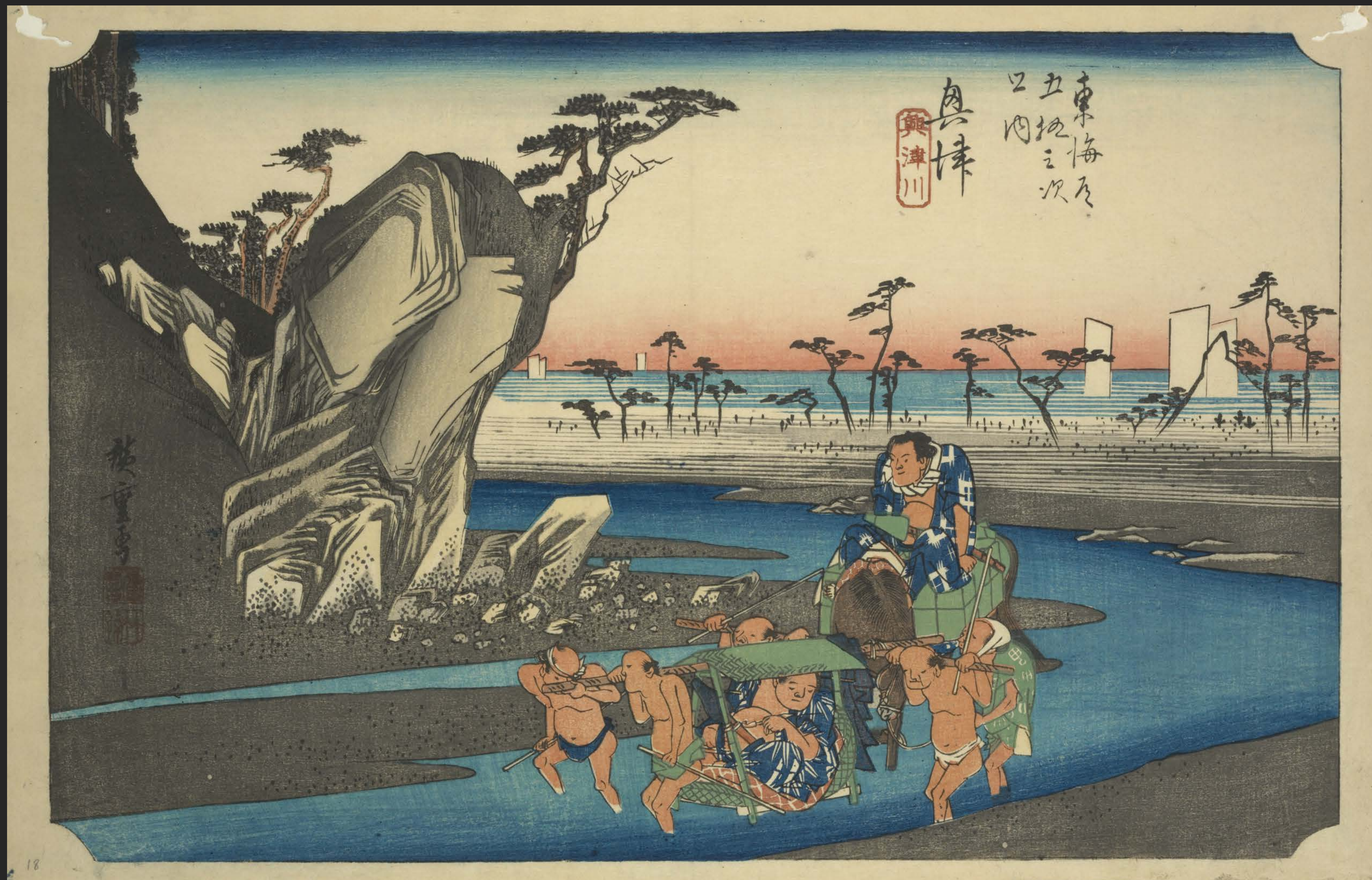
東海道五十三次之内 興津 興津川