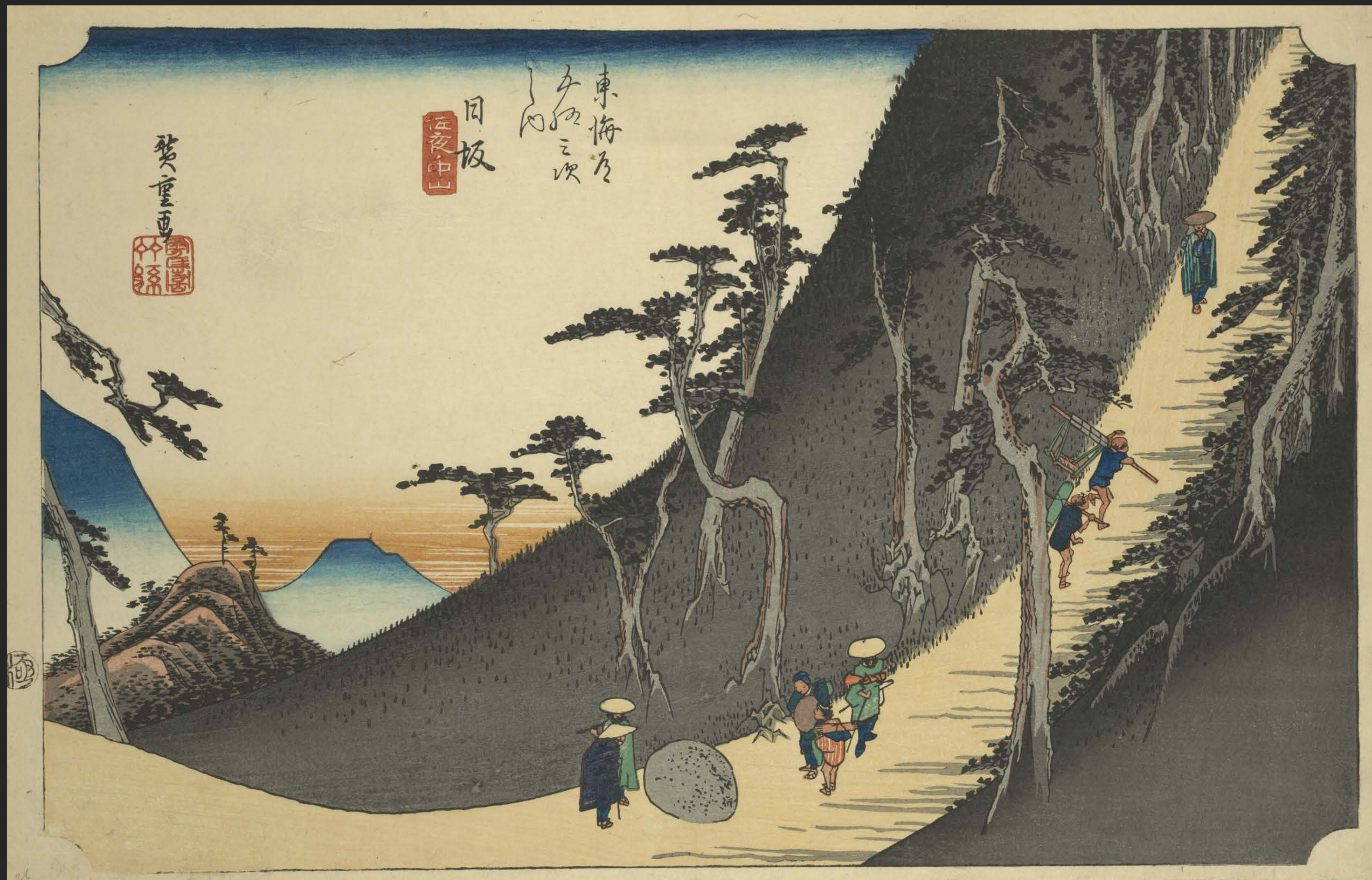
東海道五十三次之内 日坂 佐夜ノ中山