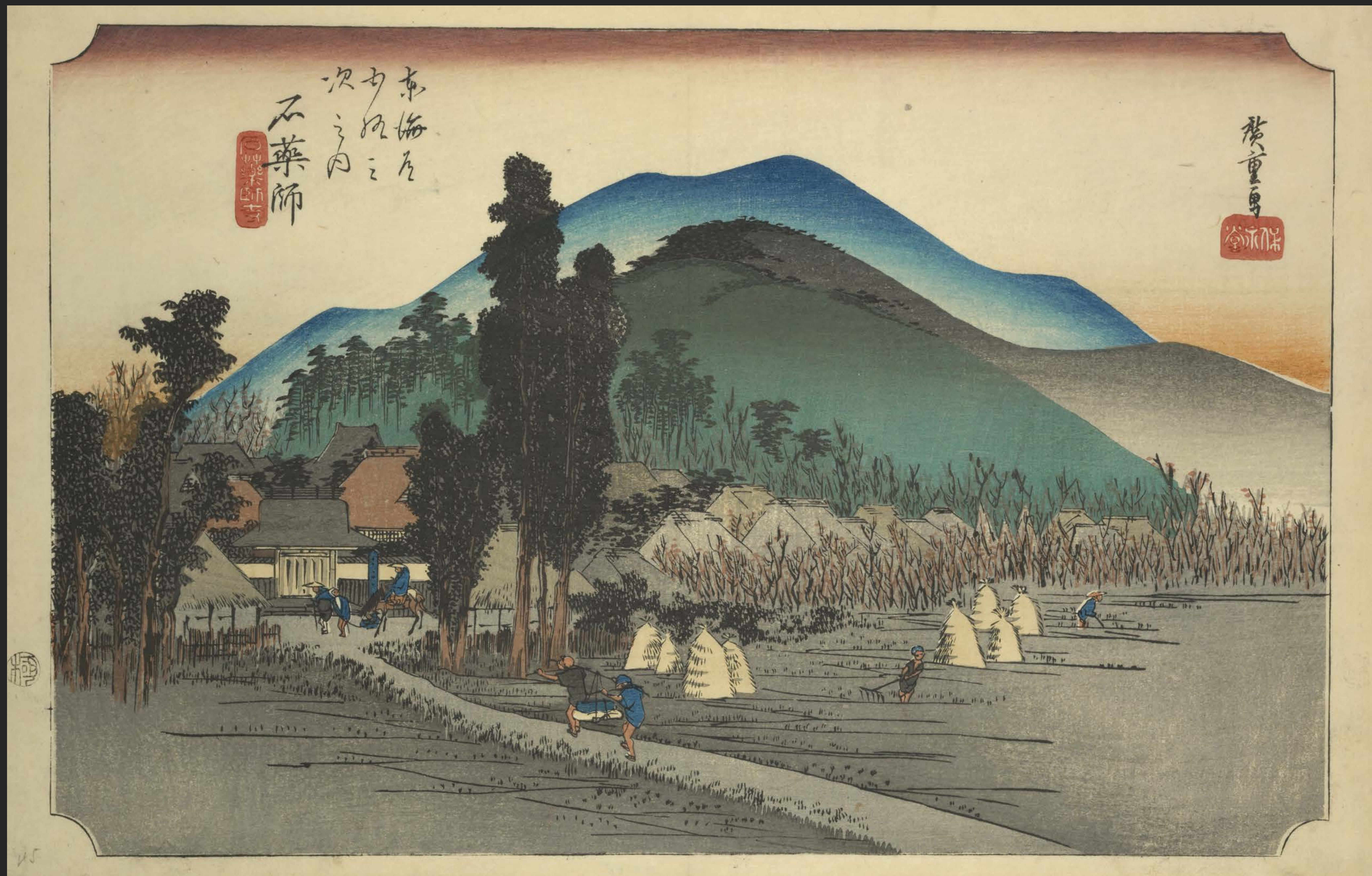
東海道五十三次之内 石薬師 石薬師寺