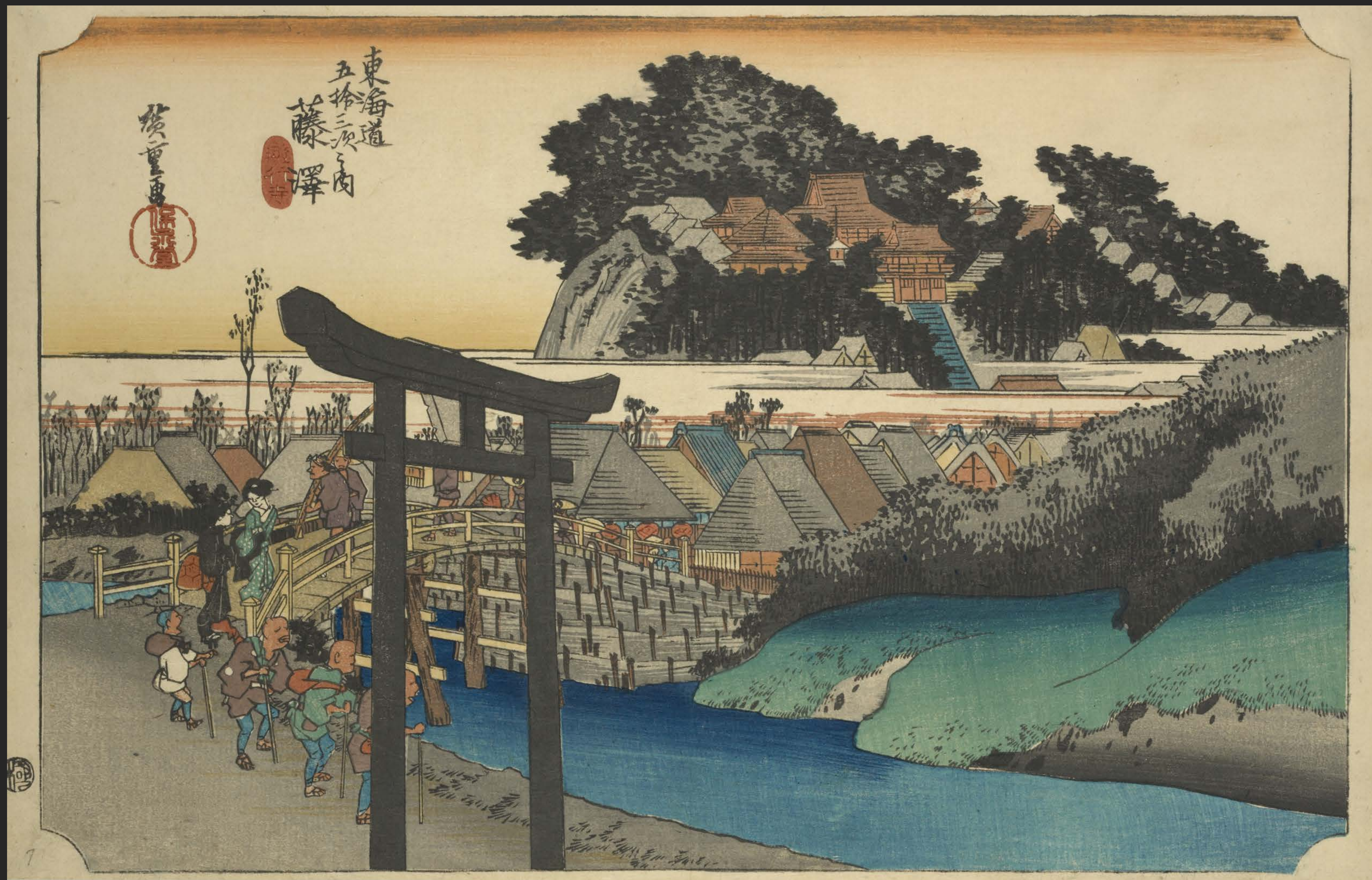
東海道五十三次之内 藤澤 遊行寺