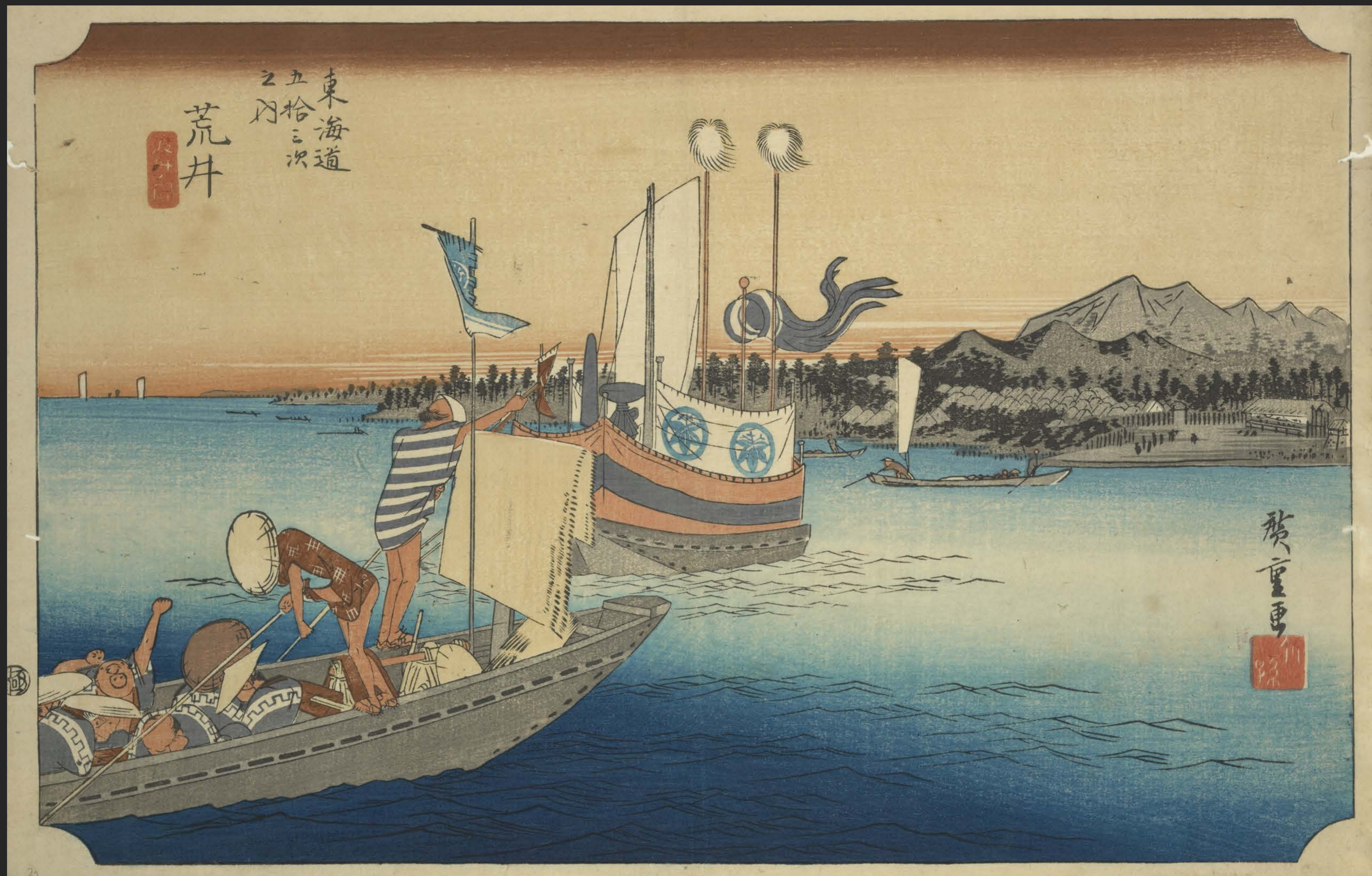
東海道五十三次之内 荒井 渡舟ノ図