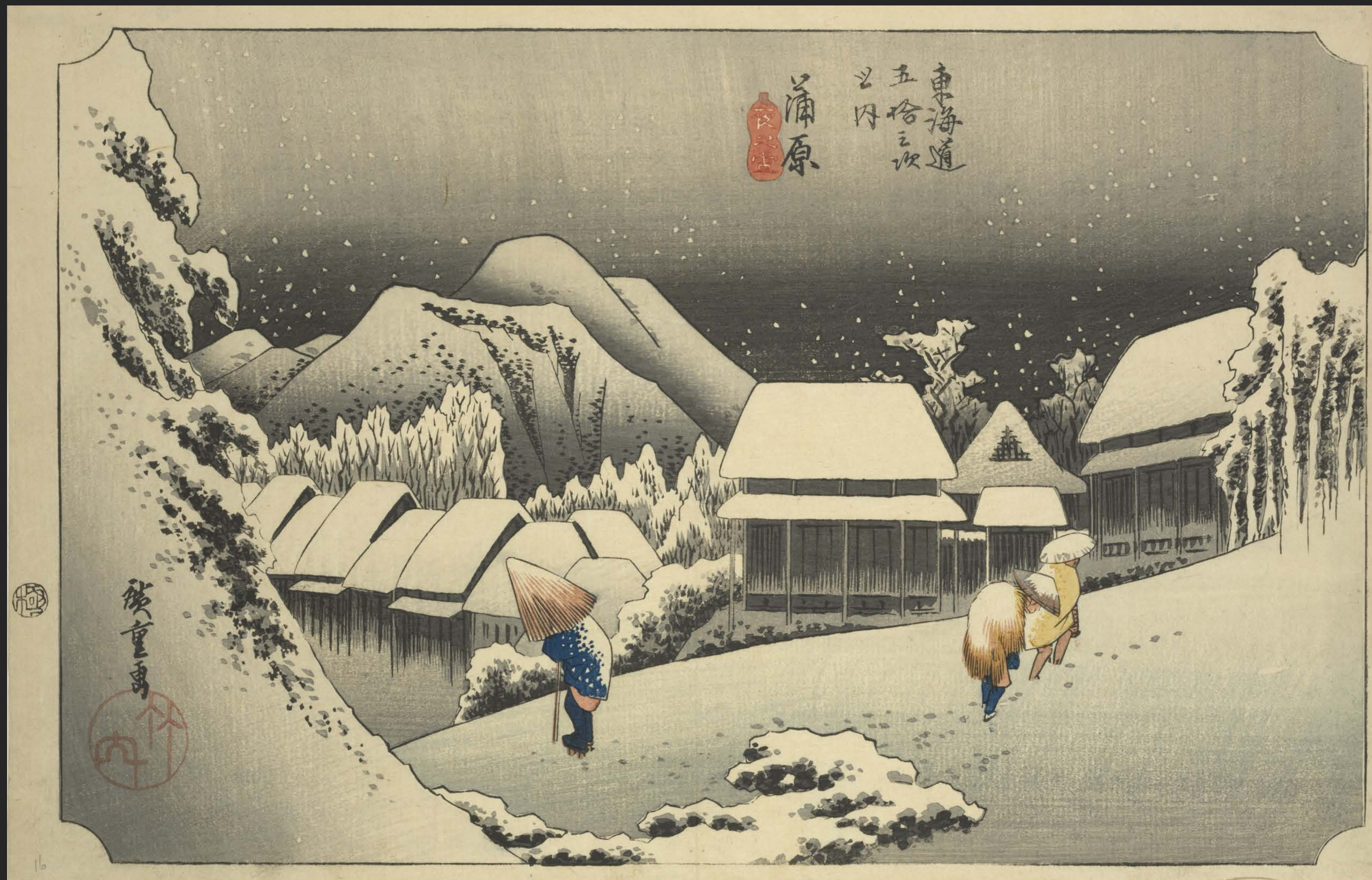
東海道五十三次之内 蒲原 夜之雪