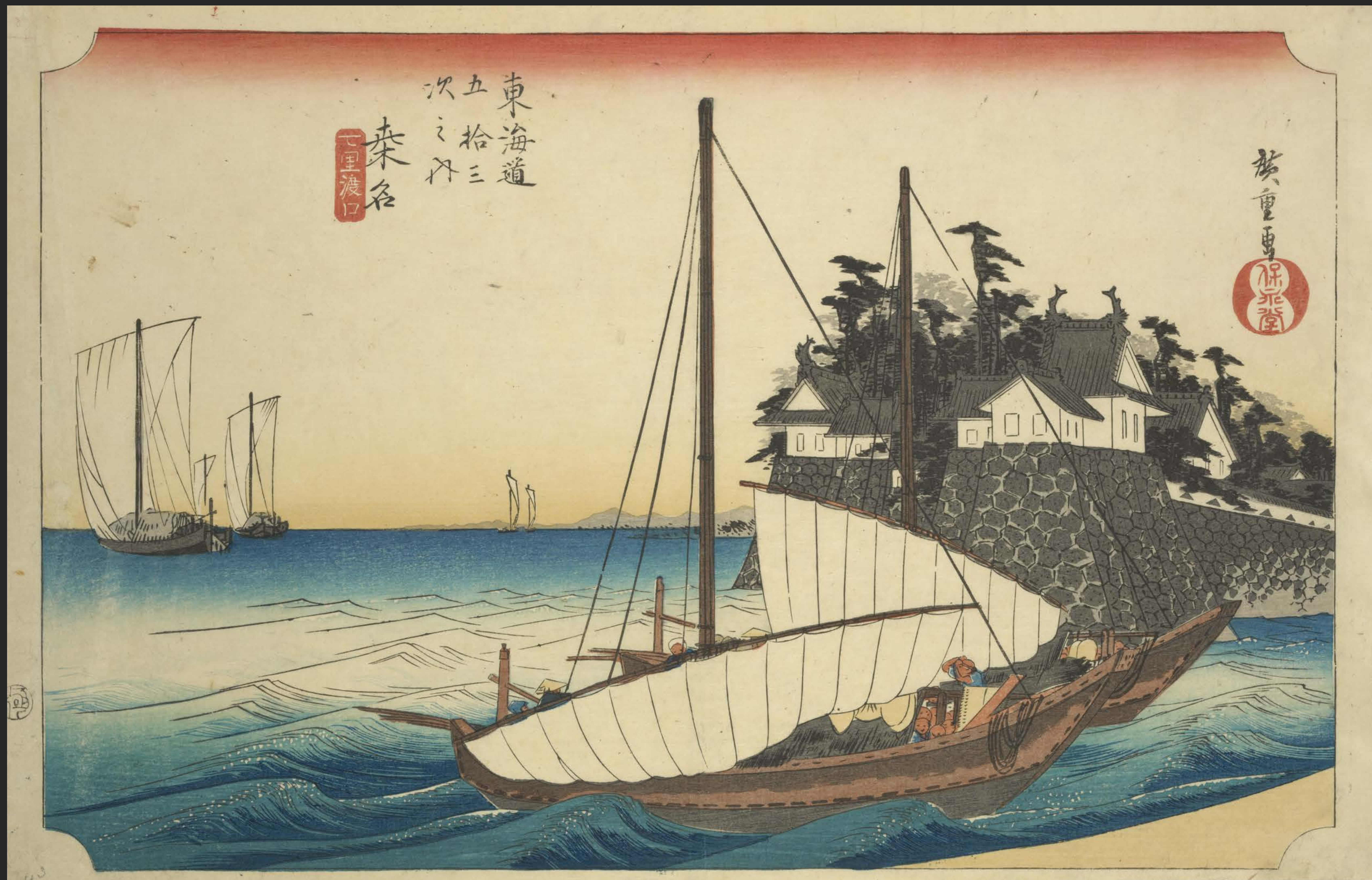
東海道五十三次之内 桑名 七里渡口