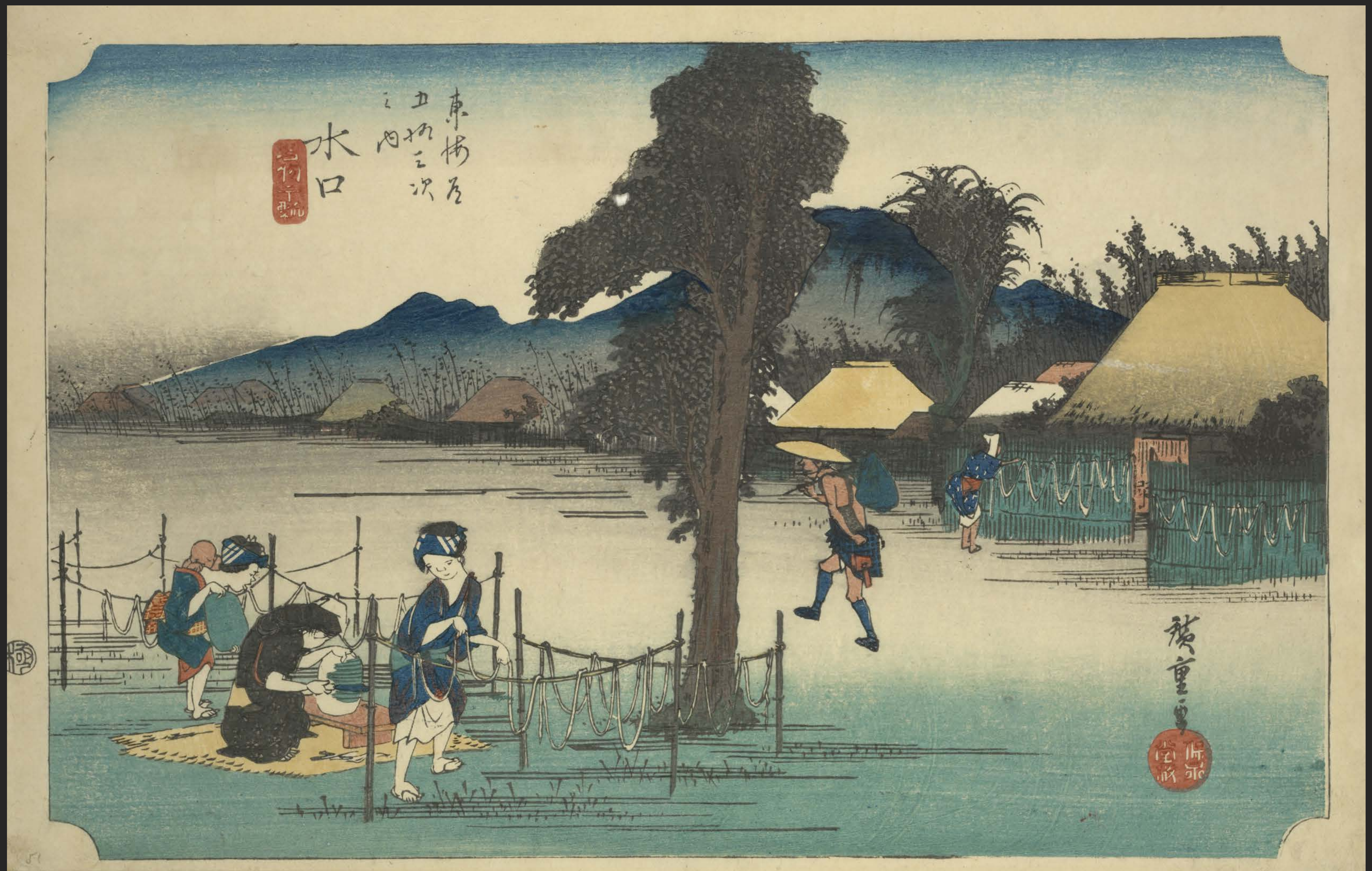
東海道五十三次之内 水口 名物干瓢