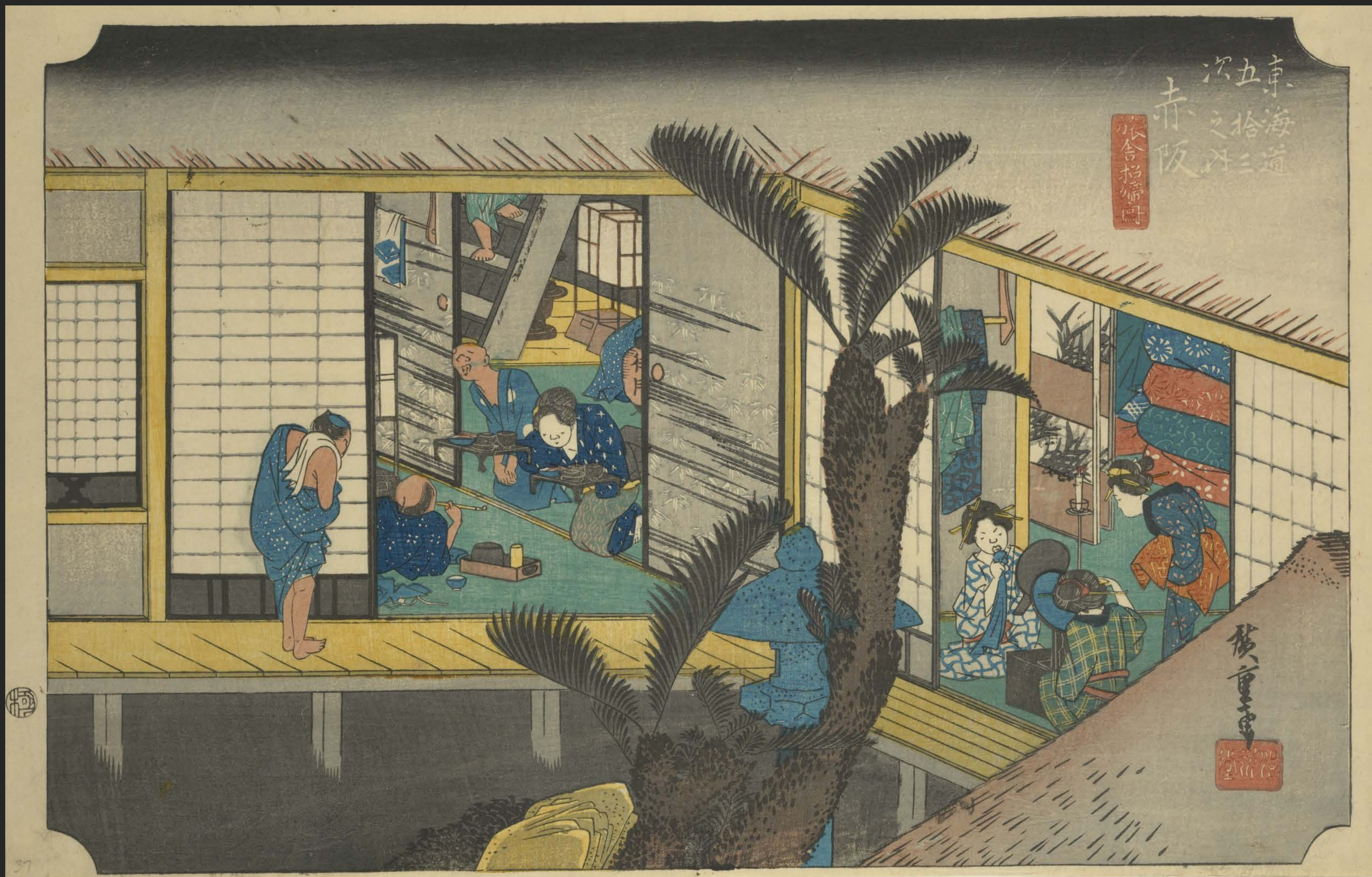
東海道五十三次之内 赤阪 旅舎招婦ノ図