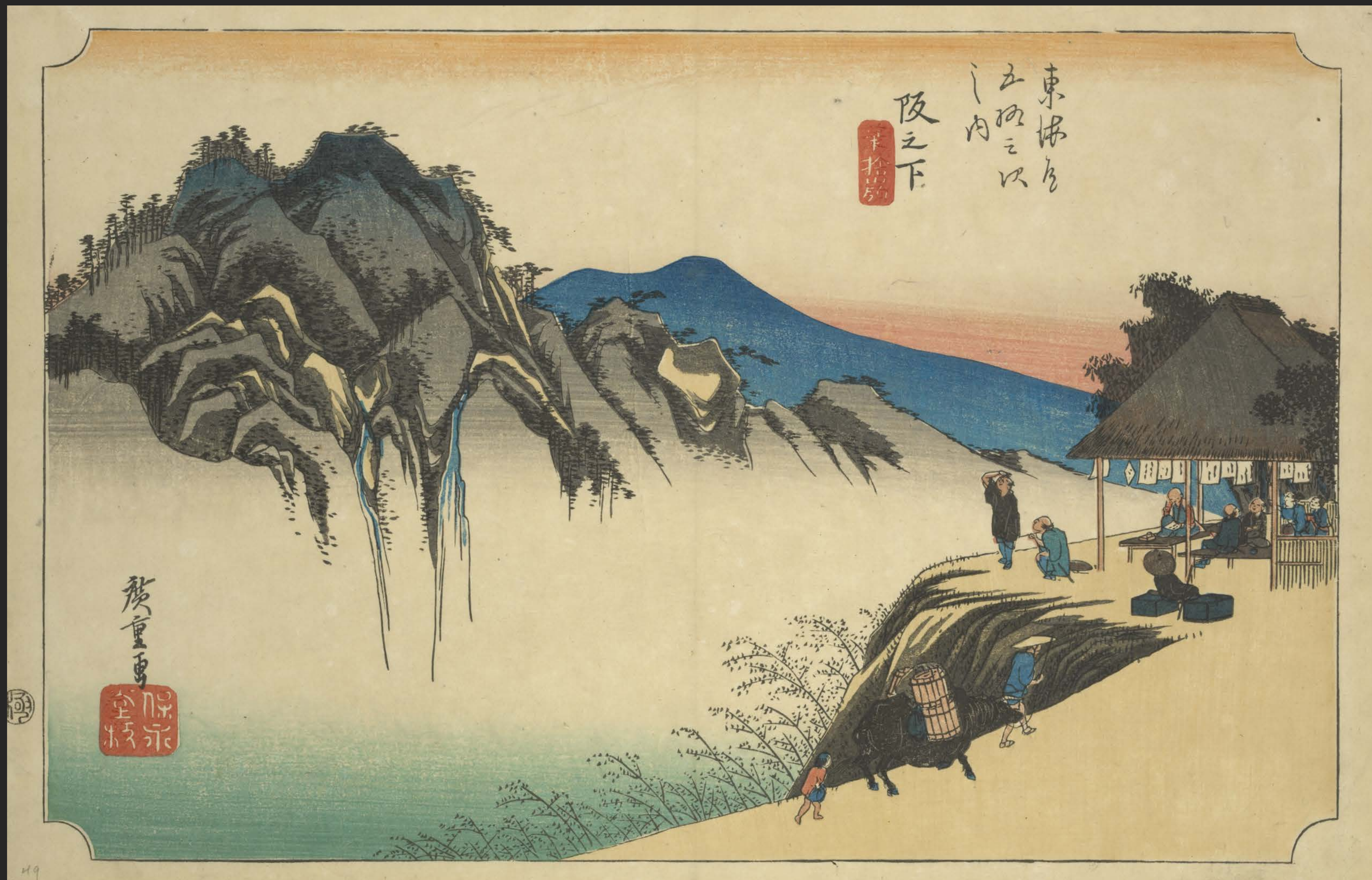
東海道五十三次之内 阪之下 筆捨嶺