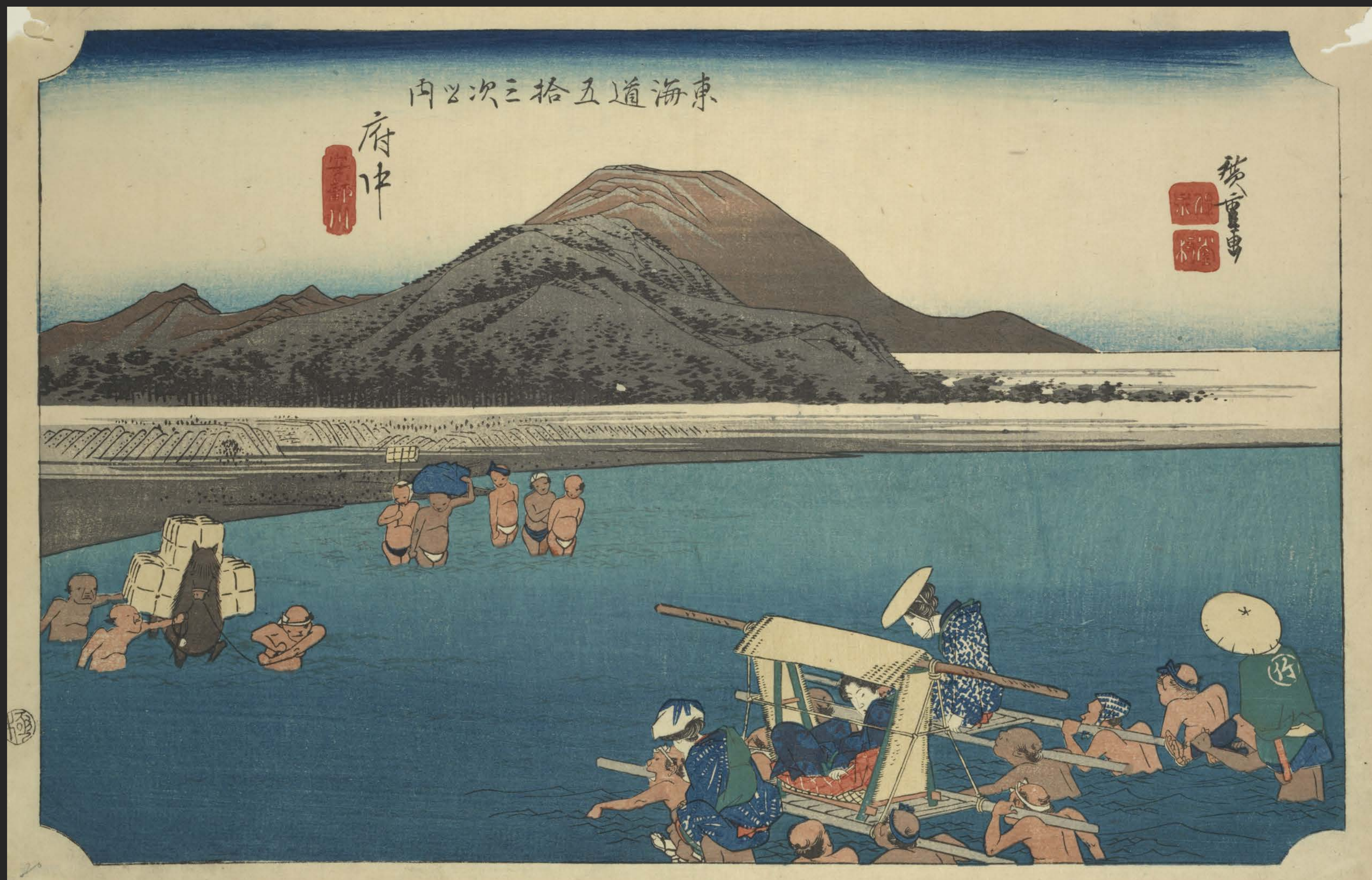
東海道五十三次之内 府中 安部川