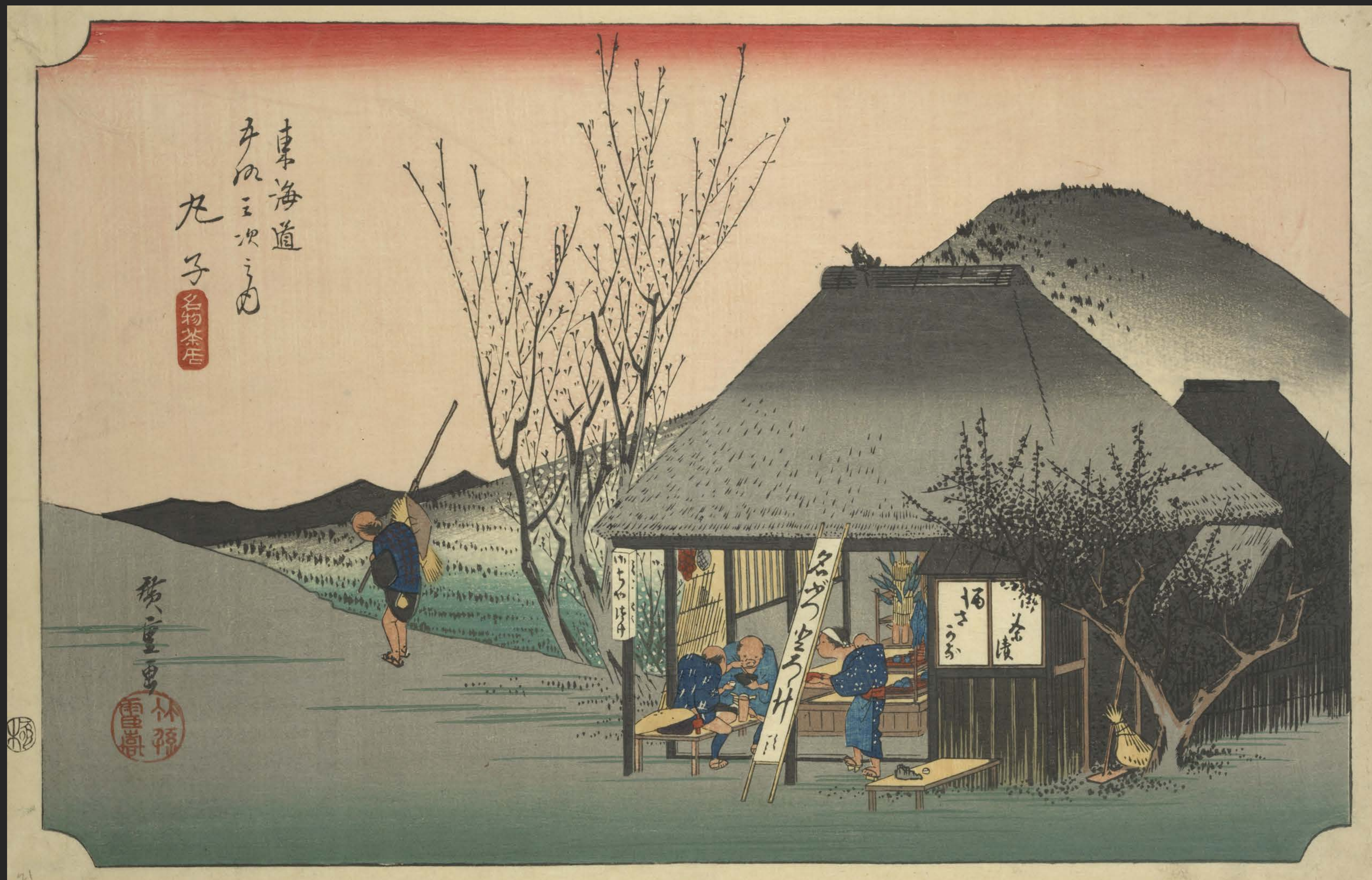
東海道五十三次之内 丸子 名物茶屋