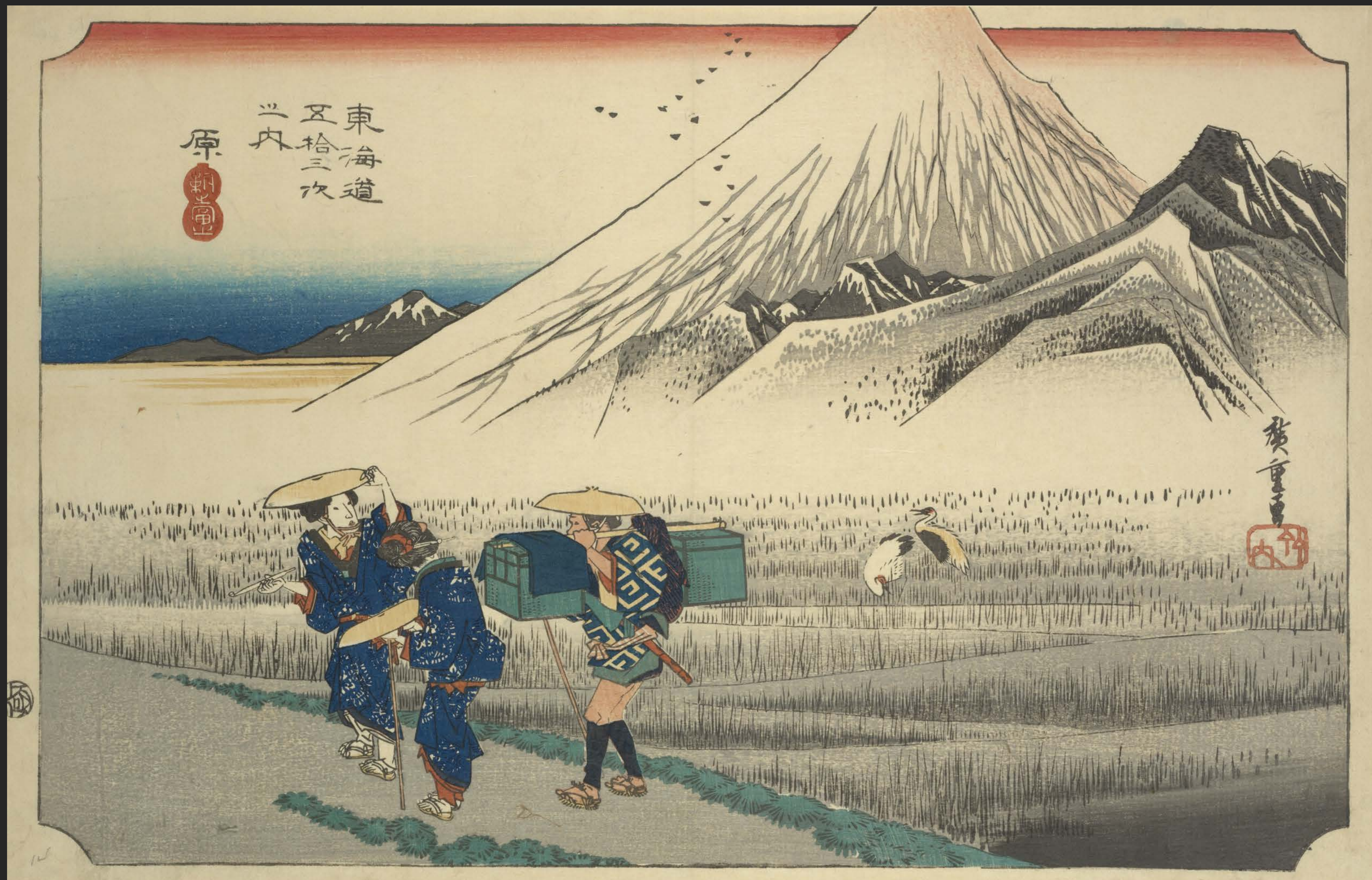
東海道五十三次之内 原 朝之富士