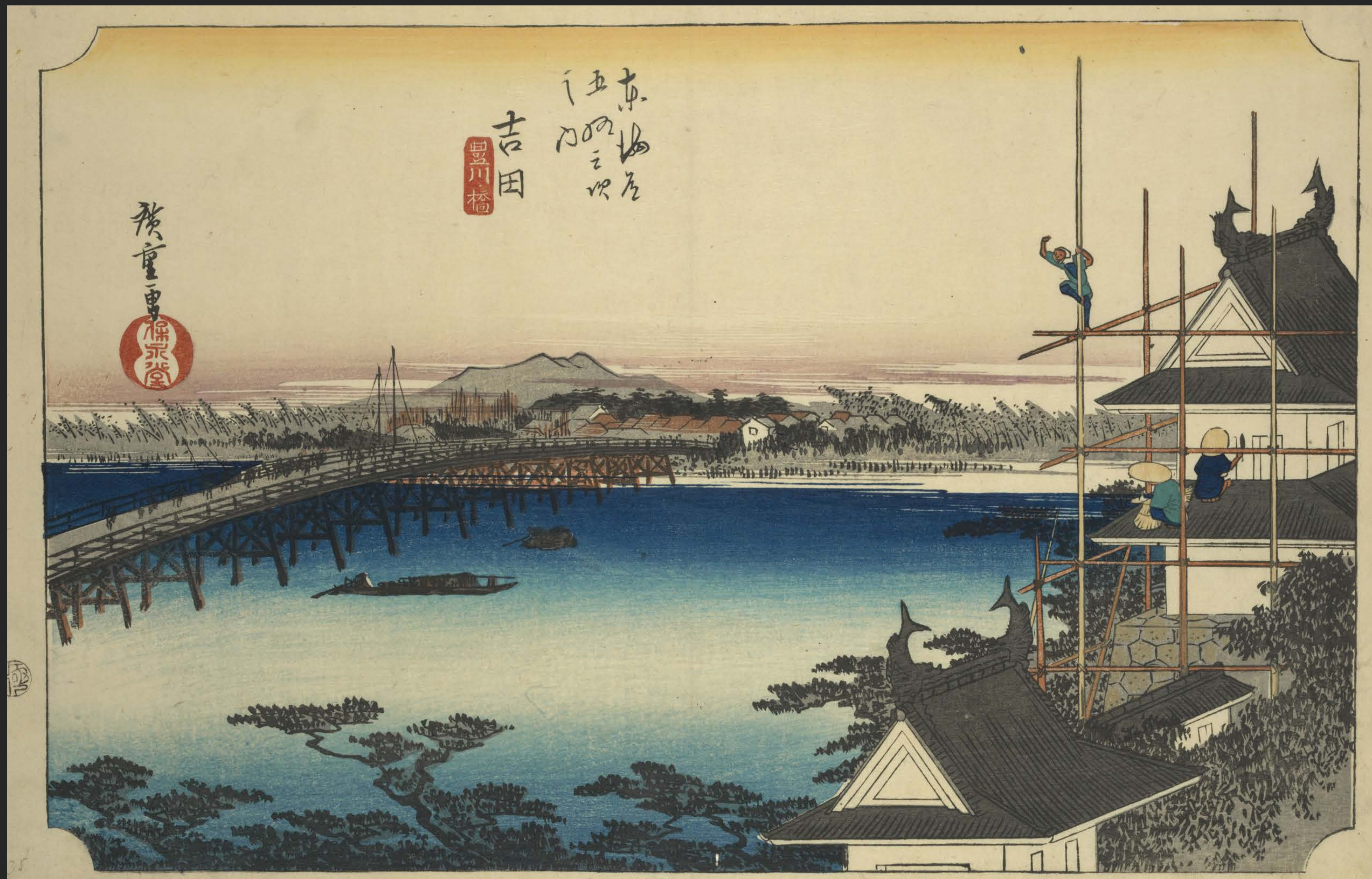
東海道五十三次之内 吉田 豊川ノ橋