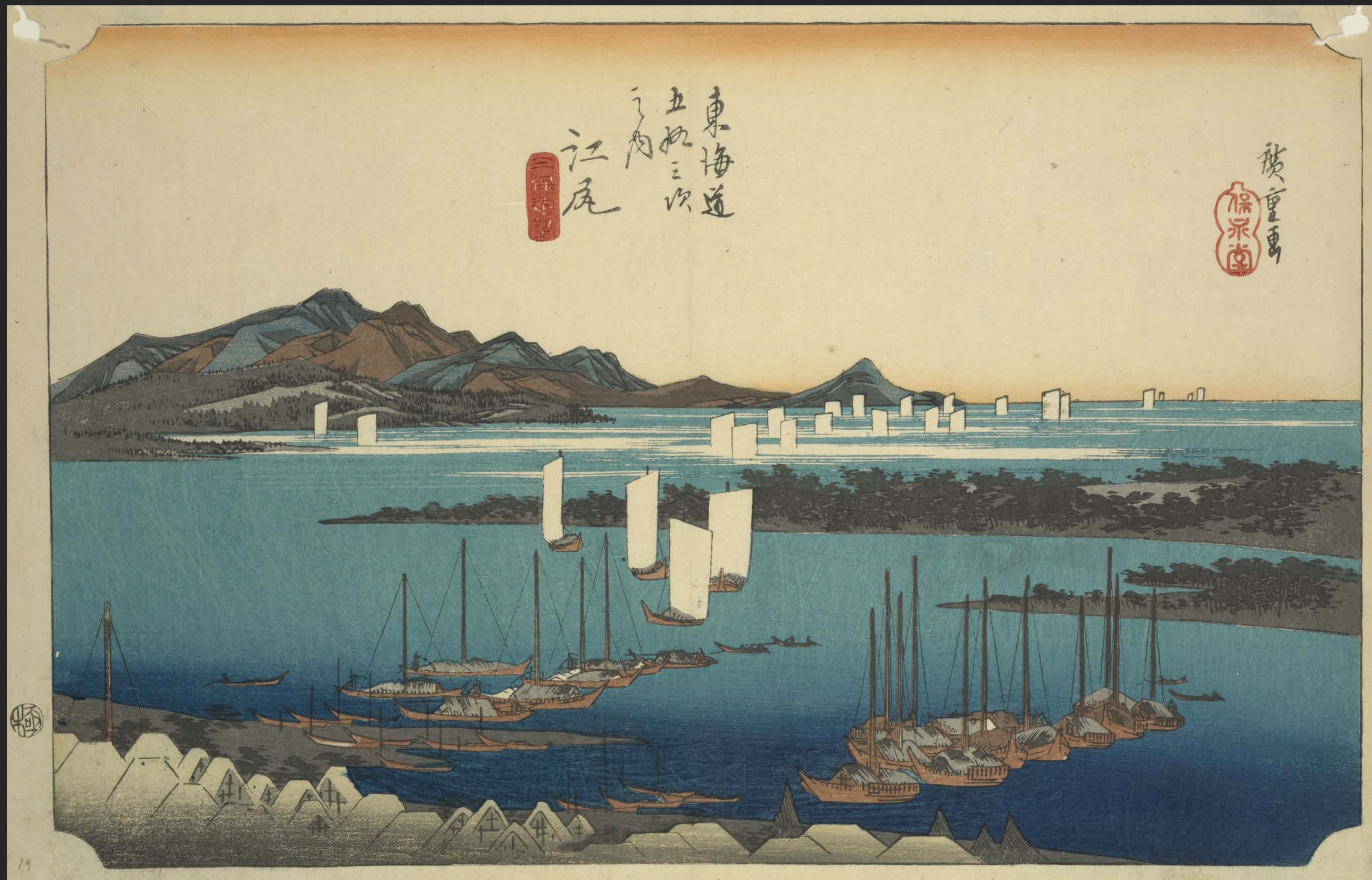
東海道五十三次之内 江尻 三保遠望