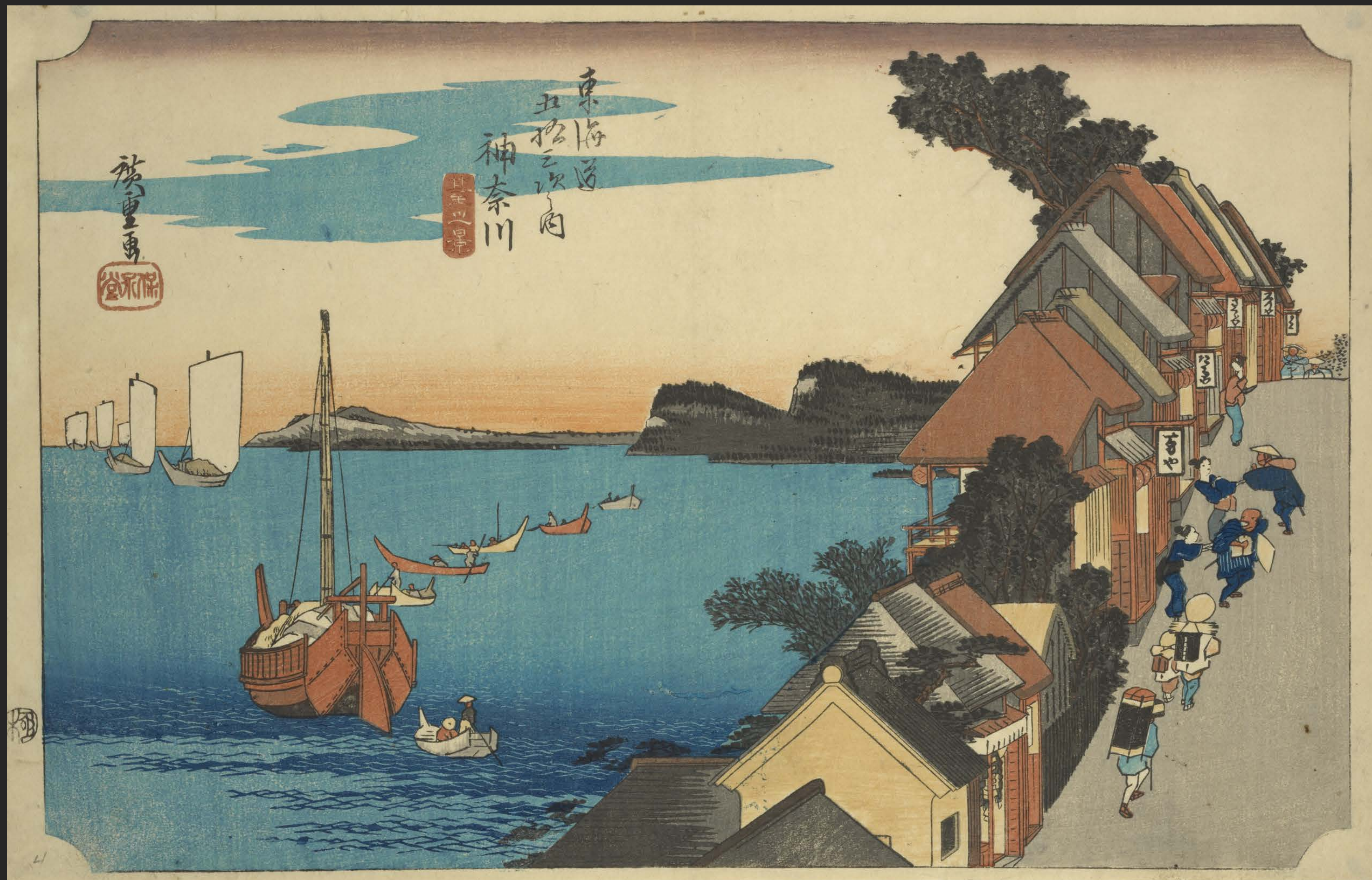
東海道五十三次之内 神奈川 台之景