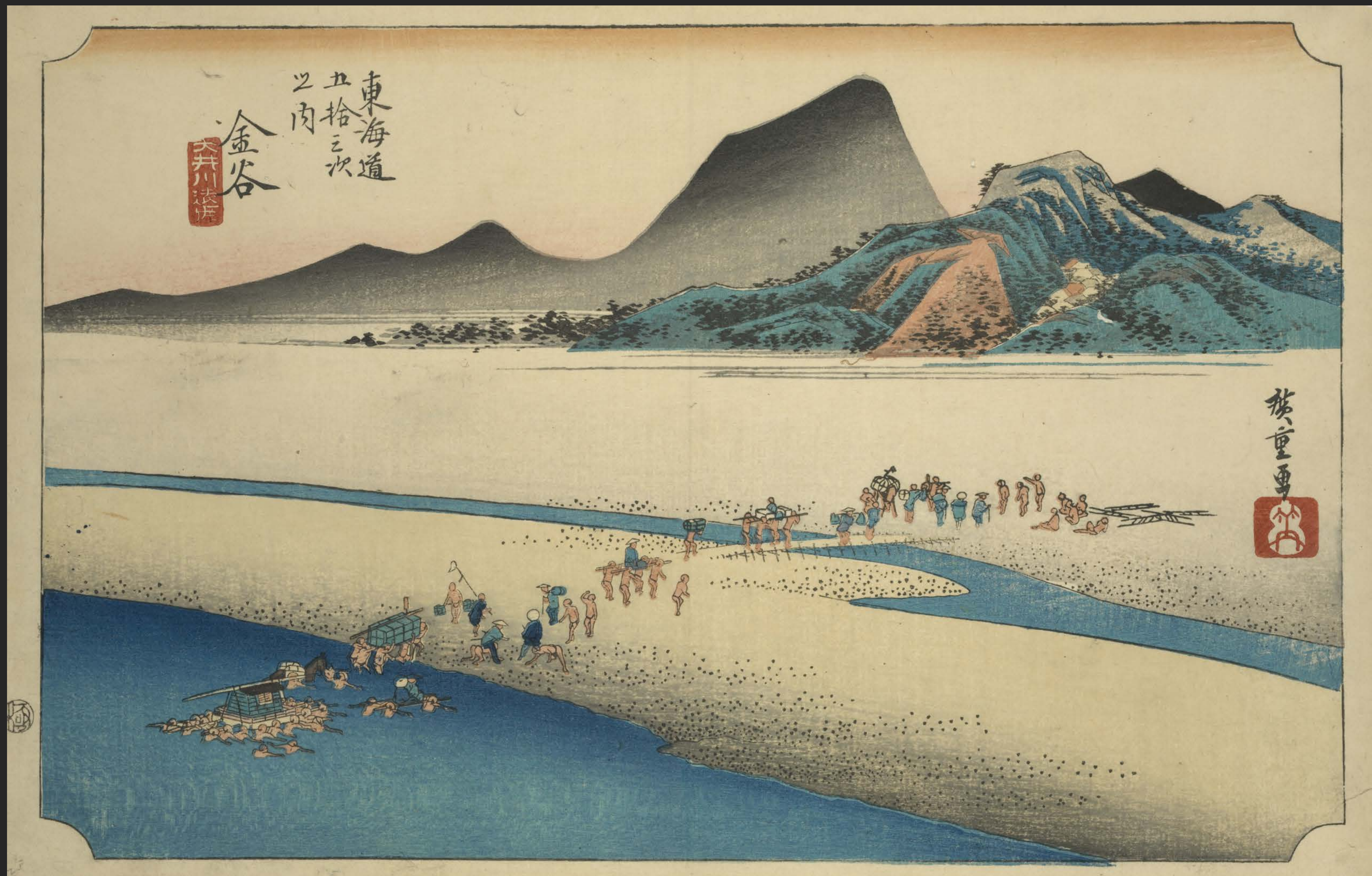
東海道五十三次之内 金谷 大井川遠岸