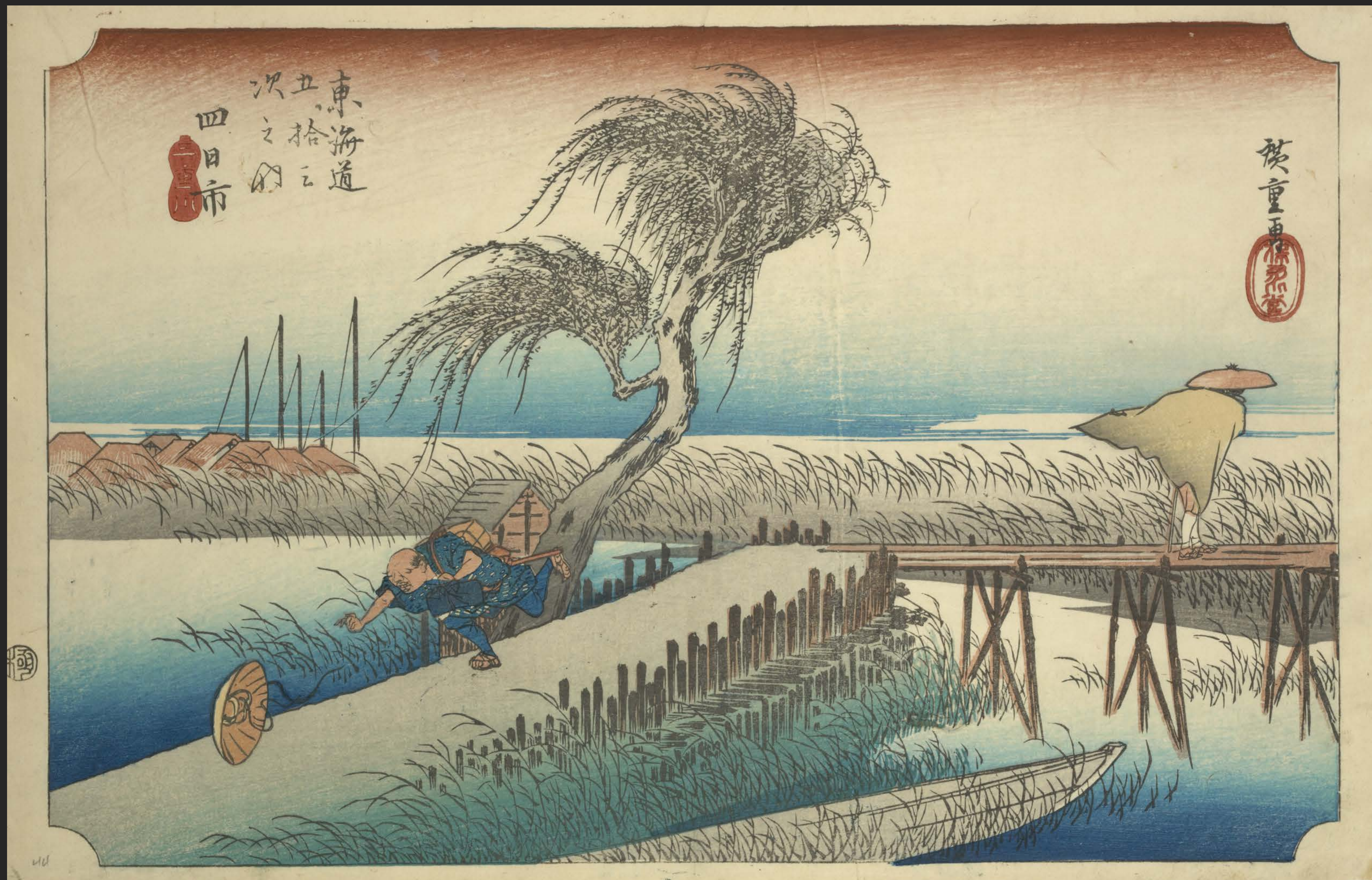
東海道五十三次之内 四日市 三重川