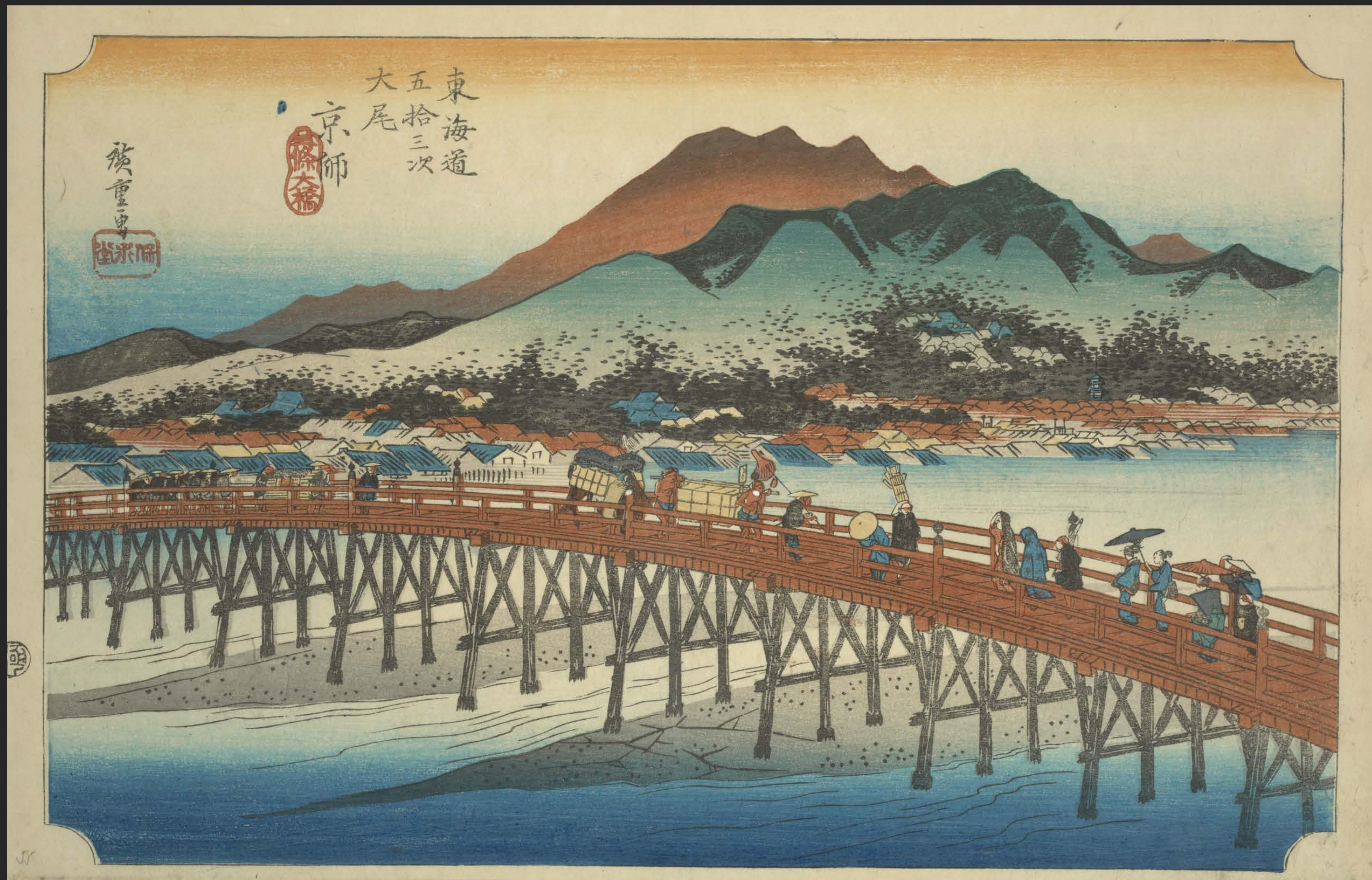
東海道五十三次之内 京師 三條大橋