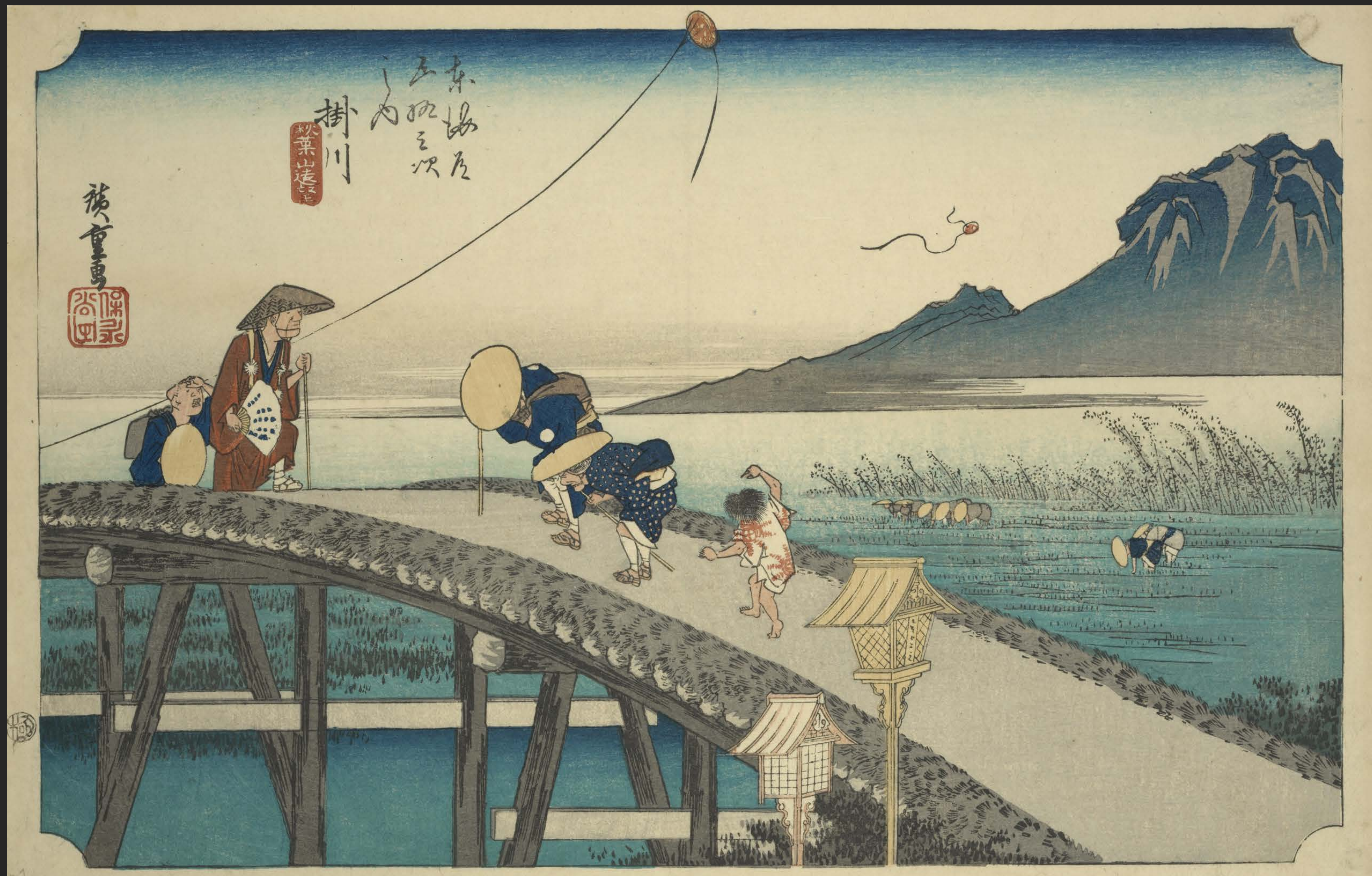
東海道五十三次之内 掛川 秋葉山遠望