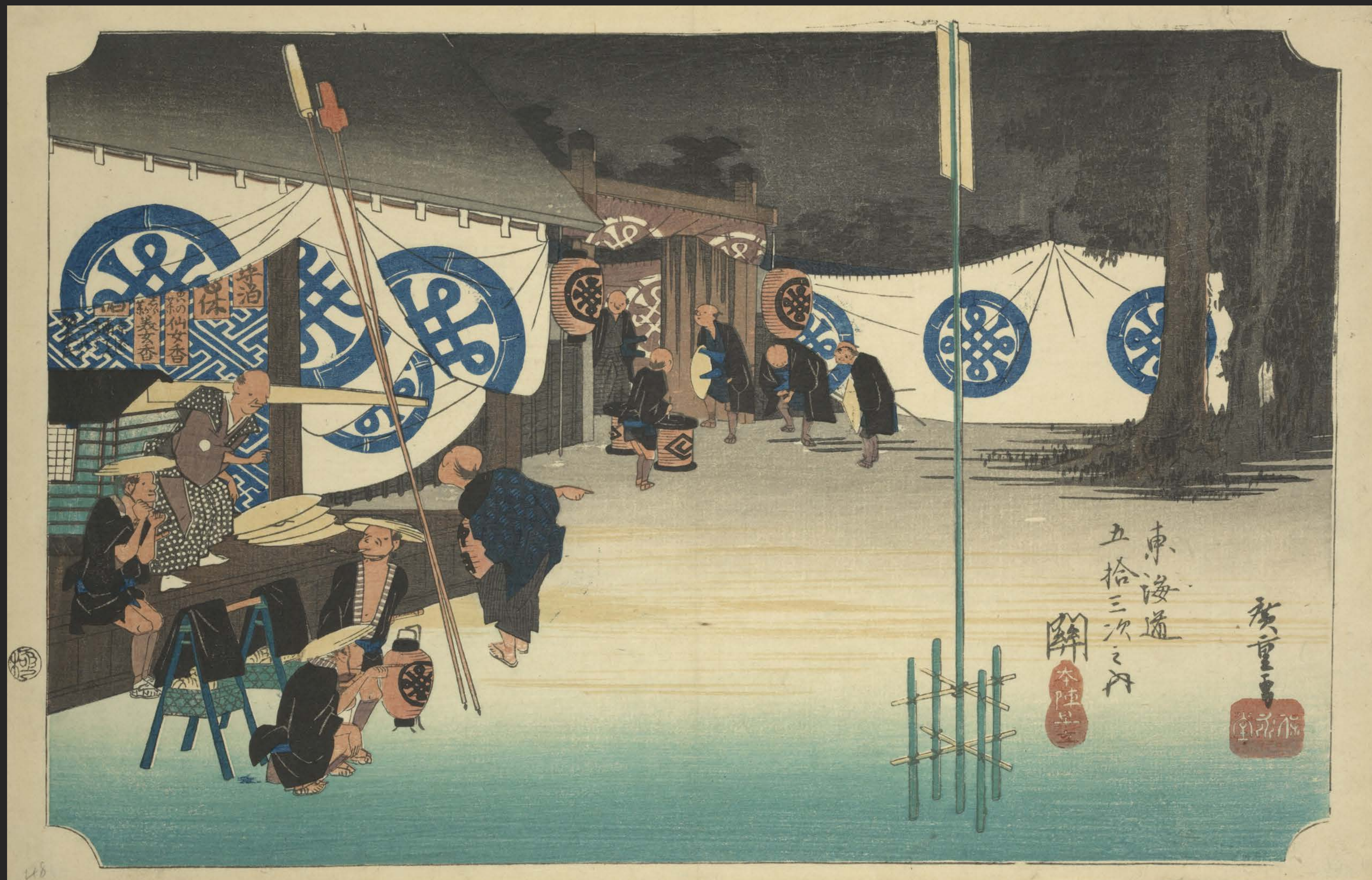
東海道五十三次之内 関 本陣早立