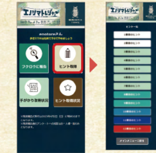
※上記サイト画面は、開発段階の内容のため、変更になることがあります。

STEP.3 謎が解けないときはヒントを入手 ヒントも「フクロウ」で入手できます。メインメニューの「ヒント取得」から正しいヒントを選びタップすると取得できます。取得したヒントは「ヒント取得状況」から見返すことができます。ただしそれぞれのヒントは、ゲームの流れにそった順番でしか入手することができません。「○番目のヒント」がどの謎がわからないときは、左のページの「HINT」の枠内を見てから、小さい番号順にヒントを取得していくことをオススメします。