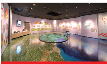
火山災害コーナー