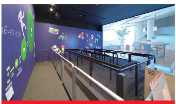
地震・津波コーナー