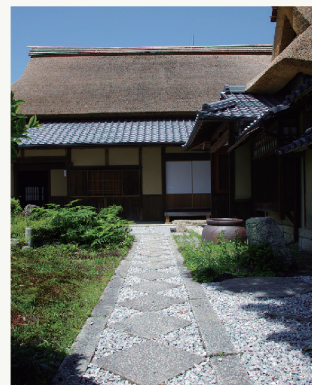
大庄屋諏訪家屋敷

「京たち守山泊まり」と呼ばれ、京都から出発して1泊目の宿にちょうど良い位置として栄えた中山道守山宿には、古い町並みや道標など、当時のなごりを示す文化財が点在しています。また、赤野井町の大庄屋諏訪家屋敷は主屋、書院、茶室などの建物と庭園が残されており、江戸時代の庄屋屋敷の様子を知ることができます。